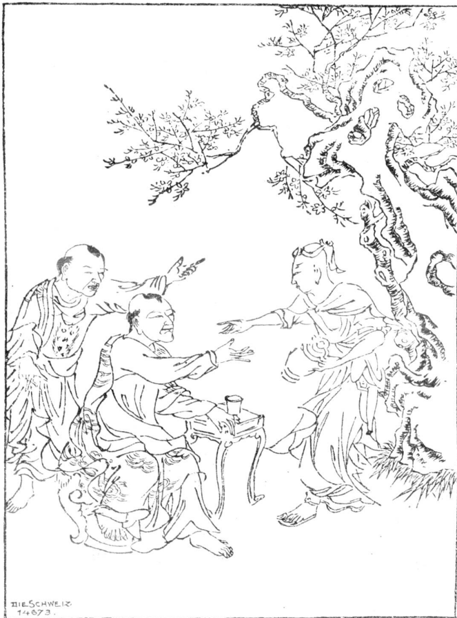
Aus einem ältern japanischen Bilderbuch.

Draußen in den Gärten und Anlagen haben sich unterdessen die Sterne der japanischen Lieblings- und Wappenblume geöffnet (s. Abb. 256). Japan ist ihre Heimat. Von Japan aus hat sie ihren Triumphzug auch zu uns angetreten, die wunderbare Goldblume, als fried-