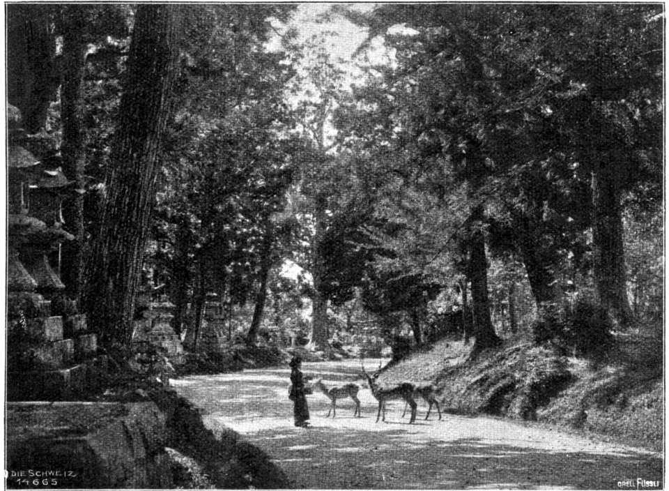
Tempelhain zu Nara.

Die Sumotori — so lautet ihr japanischer Name — bilden eine Genossenschaft und erstreben durch maßloses Essen und Trinken die größtmögliche Stärke und Schwere zu erlangen. Im Frühjahr besonders pflegen sie große Ringspiele zu veranstalten, wobei die berühmtesten Kämpen dem enthusiastischen Volk ihre Kunst zeigen. Ich habe im heiligen Bezirk des Asakusatempels zu Tokio nur Sterne dritten oder gar vierten Ranges auftreten sehen.