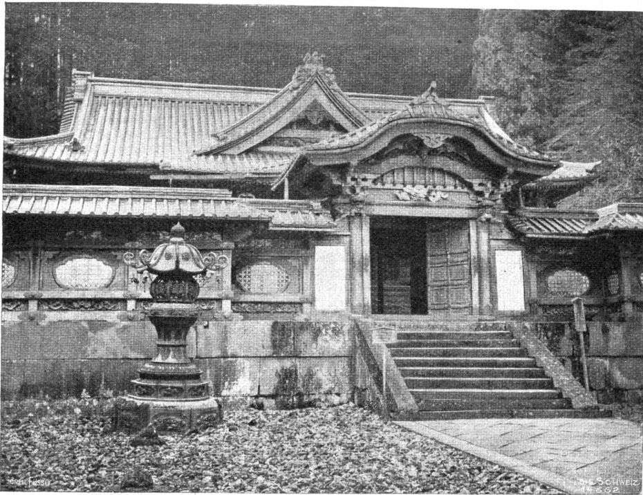
Tempel in Nikko.

an den Rand der Arena gedrängt. Ein Fuß streckte sich ins Leere hinaus, und damit war die Niederlage seines Besitzers ausgesprochen. Eine kurze Pause. Ein neues Ringergaue trat auf. Das wievielte wohl? Doch zuerst betritt die menschliche Henne, Goazi genannt, die Arena, streckt seinen Fächer aus, verbeugt sich unendlich tief nach allen Seiten hin und ruft in höchsten Füsteltönen die Namen der neuen Sumotori aus. Die beiden Necken trinken erst etwas Wasser, trocknen sich die schweißigen Hände ab, heben grüßend die Arme mit gespreizten Fingern dem Gegner entgegen; dann geht es los.