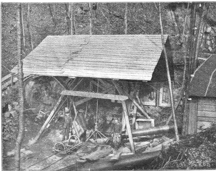
Ricken-Tunnelbau. Senkrechter Schacht zum Tunnel zur raschen Materialförderung. Von den Schächten aus wird der Tunnelbau nach beiden Seiten vorgetrieben.

Möglichst kurz, aber bestimmt entledigte ich mich des Auftrags unseres Divisionskommandanten, dahin lautend: es werde der Ambulanz der Abzug erst dann gestattet, wenn sie mit ihren eigenen Transportmitteln die sämtlichen transportfähigen Kranken der Ostarmee, die zu Orbe liegen, nach der nächsten Bahnstation evakuiert haben werde! Das hat dann aber auch wirklich den Herrschaften Beine gemacht. Schon bis zehn Uhr folgenden Morgens (8. Februar)