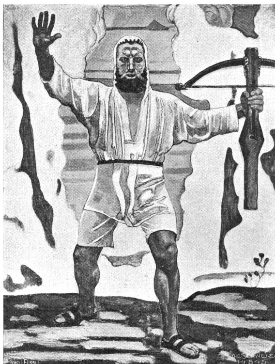
Tell nach dem Schuss.

Tell hat nicht mehr zu klagen, Luzern sich hat verkehrt, Sich aller Treu entschlagen Und alle Welt gelehrt: Bey päpstlichen Eidgenossen Seh weder Ehr noch Treu, Ab schelmischen diebspoffen Sie haben keine Scheu.