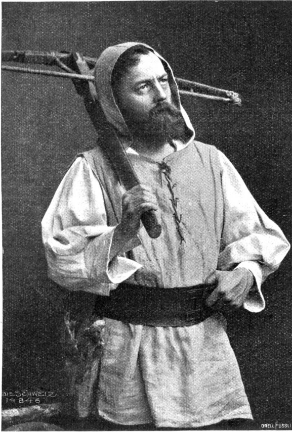
Der „Tell“ der Jubiläumsaufführungen des dramatischen Vereins der Stadt Bern.

hat den Versuch machen wollen, Tell beizuspringen, nämlich Michel; Werner hat ihn davon abgehalten, indem er ihm das Geheimnis des Bundes verrät (1930) und von dem Angriff Kenntnis gibt, der auf Geklers feste Burg unternommen werden soll. Er vergift Berners Vertrauen dadurch, daß er ihm seinerseits mitteilt, während der Nacht werde er von seiner Geliebten in eben diese Burg eingelassen werden: sobald er sie in Sicherheit gebracht habe, werde er ohne Schwierigkeit im Turm so viele seiner Freunde verstecken können, als er bei der Kürze der ihm zu Gebote stehenden Zeit zu sammeln vermöge.