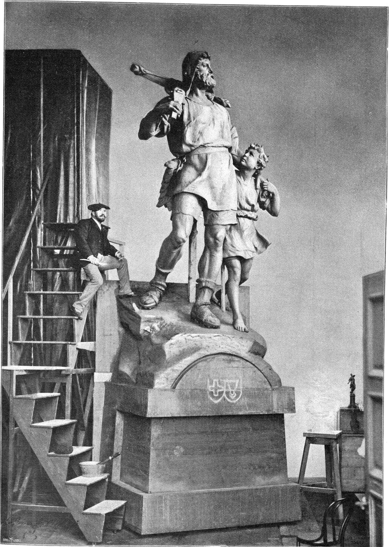
Richard Kisslings Tellstandbild im Atelier des Künstlers.