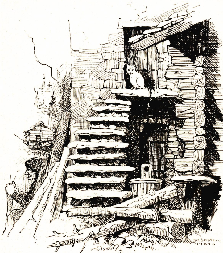
Hütte bei Herbriggen im Zermattal. Nach Federzeichnung von Jakob Billeter, Basel.

Er schüttelt richtete sich Wentgraf auf; denn die großen,