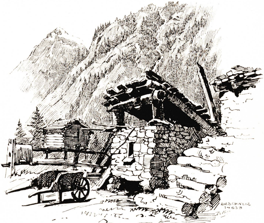
Gemeindebackofen bei Randa-Wildi. Nach Federzeichnung von Jakob Billeter, Basel.

„Sie sind zu mir gekommen, Eva,“ sprach er zärtlich.