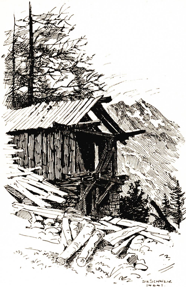
Säge bei Randa. Nach Federzeichnung von Jakob Billeter, Basel.

Eva zauderte noch eine Zeit lang; doch sie wußte nicht, was sagen und fragen, und Gunter hob die Augen nicht mehr zu ihr auf. Da seufzte sie leise und wandte sich