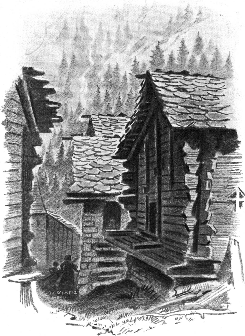
Gasse in Randa bei Zermatt. Nach Zeichnung von Jakob Billéter, Basel.

„Doch, wenn ich deine Stimme hören will; denn den Sinn fasse ich dann nicht. Und dann ist mir lieber,