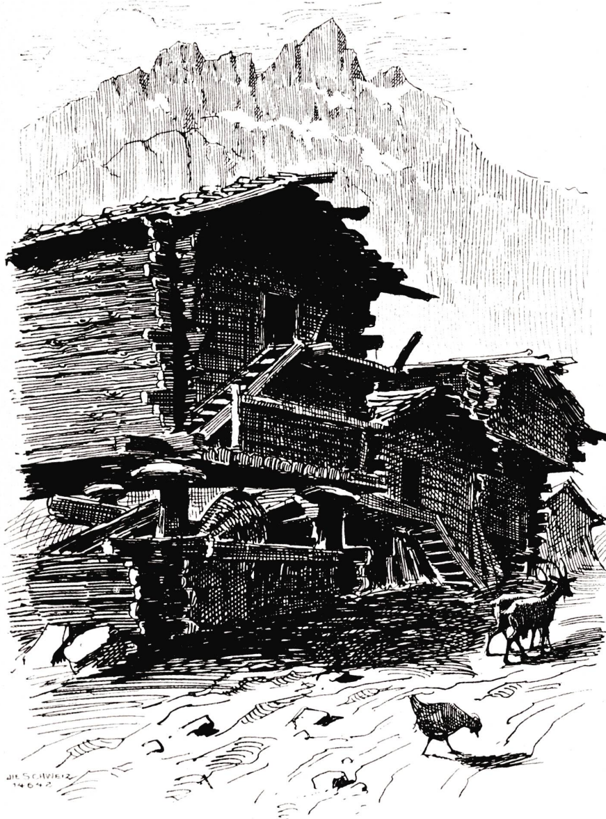
Caesch gegen die Mischabelgruppe. Nach Federzeichnung von Jakob Billéter, Basel.

gekrönten Säulen, zwischen denen der Wind durchspielen und das Wasser die Halde hinunterlaufen kann, wo auch das Kleinvieh seinen Unterschlupf findet, ruht das einstöckige, aus braunem Lärchenholz gefügte Haus, zu dem man mittelst einer Leiter gelangen muß. Das Schindeldach ist abermals mit schweren Steinen belastet, die wieder mancherlei Gräslein und Kräutlein als Anhaltspunkt dienen, also daß das Ganze aus einiger Entfernung sich dem Auge kaum vom Boden abzuheben scheint. Die breiten Steinplatten über den Säulen sollen dazu dienen, die Mäuse vom Erstklettern der Häuser abzuhalten. Dem Gefüge des Hauses entspricht auch der Charakter des Volkes, das, in die einsame Stille des Hochgebirges gebannt, alltäglich sein Leben neu erkämpfen muß: wortlos trägt der Wildhauer die riesigsten Lasten auf der Schulter, um seinem Viehstand die Wintertrost zu sichern; wortlos besorgen die Frauen ihre Krautgärtchen und Wirtschaften in der verräucherten Steinhöhle, die als Küche dient; aber arbeitstüchtig ist das Volk und heimatsliebend und hat mit tapferer Hand gegenüber den begehrliehen Grafen und Herzogen von Savonen seine Selbstständigkeit zu wahren gewußt, bis es sich zum ewigen Bund an die Eidgenossenschaft anschließen konnte.