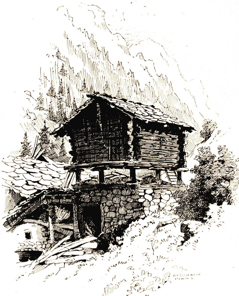
Zwischen Randa und Taesch (im Zermattertal). Nach Federzeichnung von Jakob Billeter, Basel.

Die Bauart der Häuser wird jedem auffallen, der zum ersten Mal diese Gegenden betritt; denn da bei vollständigem Mangel an Ton und Kalk das Volk durchaus auf den schwer zu bearbeitenden Granit und Gneis angewiesen ist, so gewinnen die Wohnungen etwas Urweltliches. Auf vier aus rohen Steinblöcken aufgeschichteten, röhrenförmig mit einer Granitplatte