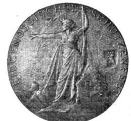
Der sog. „Schützenaler“ (Revers).