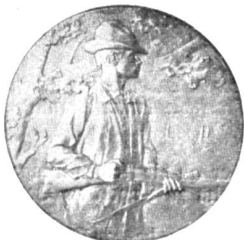
Der sog. „Schützenaler“ (Avers).

Es stieg ein kurzer, klager Laut von der Wiege hinter dem schlafenden Manne auf.