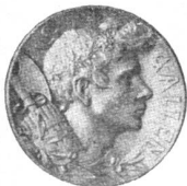
Goldene Medaille (A.).

gemacht. Die Festhütte haben wir in ihrer Bauweise bereits am eidgenössischen Turnfest in Zürich letztes Jahr kennen gelernt; neu daran ist einzig die künstlerisch ausgeschmückte Hauptfassade. Wenn sie in St. Gallen so Vielen Schutz gewährte gegen die Glut der Sonnenstrahlen wie in Zürich vor dem unaufhörlich rieselnden Naß, so dürften die St. Galler mit Festwetter und