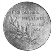
Goldene Medaille (B.).