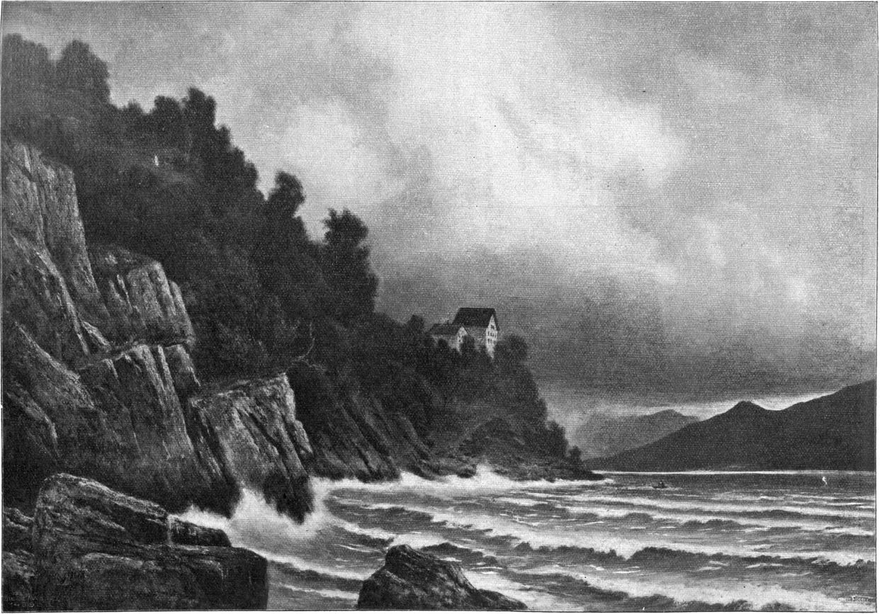
Sturm am Walensee (bei Quinten). Nach dem Gemälde von Paul Stäger, Zürich.