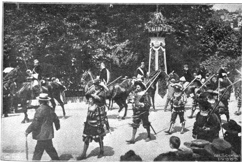
Eidg. Schützenfest in St. Gallen. Jürker Gruppe mit Studenten.

„Du weißt, daß ich mich damals . . . als die Geschichte mit dem Trinken aus Aerger über meinen verfehlten Beruf schon angefangen hatte . . . auf deinen Rat rasch entschlossen nach einer Frau umsaß. Vielleicht nur zu rasch . . . ich habe es erfahren. In dem Weibe, das ich zum Altar führte, glaubte ich anfänglich gefunden zu haben, was mir nottat. Sie war ein hübsches, gescheites Mädchen von etwas heißblütigem, sinnlichem Temperamente, sodaß ich in meiner damals noch jugendlichen Leidenschaftlichkeit bald Feuer fing. Ja, die Flammen loderten in der ersten Zeit . . . und sie wußte sie recht geschickt zu schüren . . . derart auf, daß sie in einer schwülen Sommernacht, mein klares Denken störend, meine Sinne verwirrend über mir und meiner Verlobten, die mir, wie es schien, in leidenschaftlicher Glut auf halbem Wege entgegenkam, zusammenzuschlugen. Sie gab sich mir zu eigen. Als der Rausch verfliegen und ich in der nächsten Zeit wieder nüchterner geworden war, merkte ich bald, daß etwas zwischen uns anders geworden sei . . . Wir waren nicht mehr unbefangen . . . Der feine Duft feuchter Liebe und Sehnsucht war von unserm Verhältnisse abgestreift und ein gegenseitiges Schuldbewußtsein legte sich wie