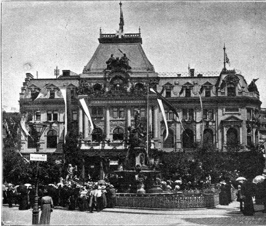
Eidg. Schützenfest in St. Gallen. Gabelhalle. Empfang der Vereine.