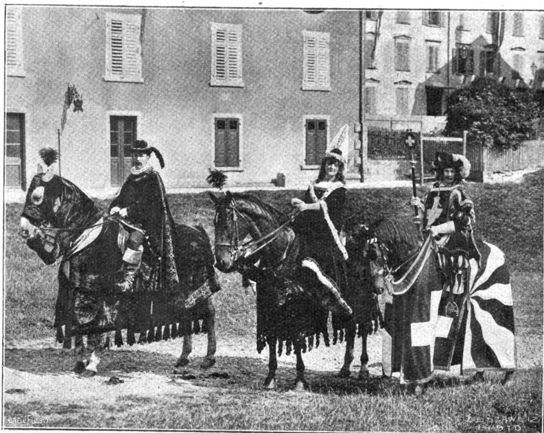
Eidg. Schützenfest in St. Gallen. Jda von Toggenburg (Phot. Ch. Schalk & Ebinger, St. Gallen).

„Was sprichst du da,“ unterbrach ich ihn, „auch in der Ehe Zwang? Wie verstehe ich das? Daß ja nachher bei euch nicht alles gestimmt, vieles zu wünschen übrig gelassen hat, das weiß ich . . . Aber ich dachte doch, daß du in freier Wahl und ohne Zwang dir deine Gattin ausgesucht hast?“