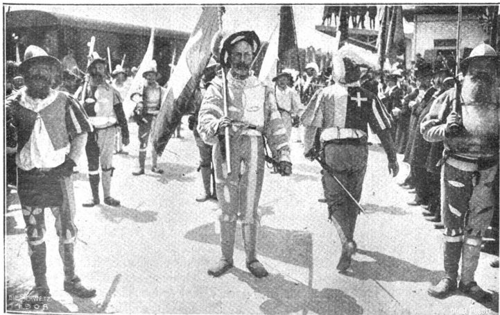
Eidg. Schützenfest in St. Gallen. Eidg. Bannerträger im Festzug in Wyl (Phot. Ph. & C. Lutz, Zürich).

Dann las er, und es machte einen grotesken, ja fast einen schaurigen Eindruck, den verwahrlosten Trunkenbold, der noch halb im Banne der durchzechten Nacht stand, die Verse seines wohlklingenden Gedichtes vorlesen zu hören.