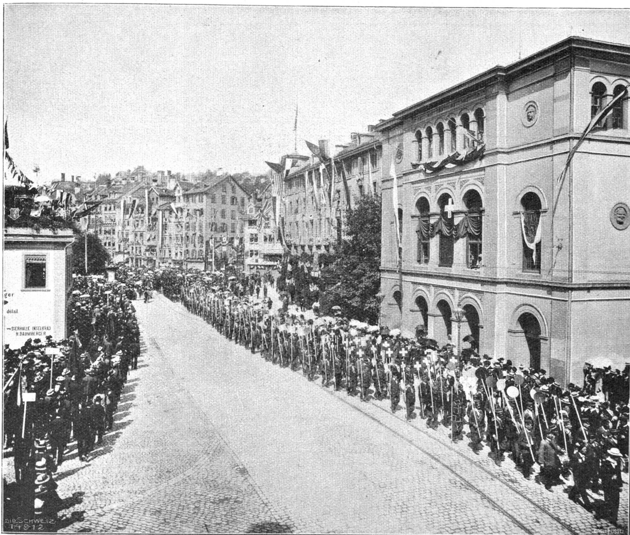
Eidg. Schützenfest in St. Gallen. Zelger im Festzug.

Qual der schauerhaften Erkenntnis, nicht mehr umkehren und nicht mehr sich aufraffen zu können! O, wie schön müßte das sein, stumm und still zu liegen und sich in die warmen Arme der Allmutter Erde zu schmiegen, unterzugehen ... ein Stäubchen, ein winziges ... in der Unendlichkeit des Weltalls ... der Natur, und sich nach ihrem Willen ... chemisch umgesetzt