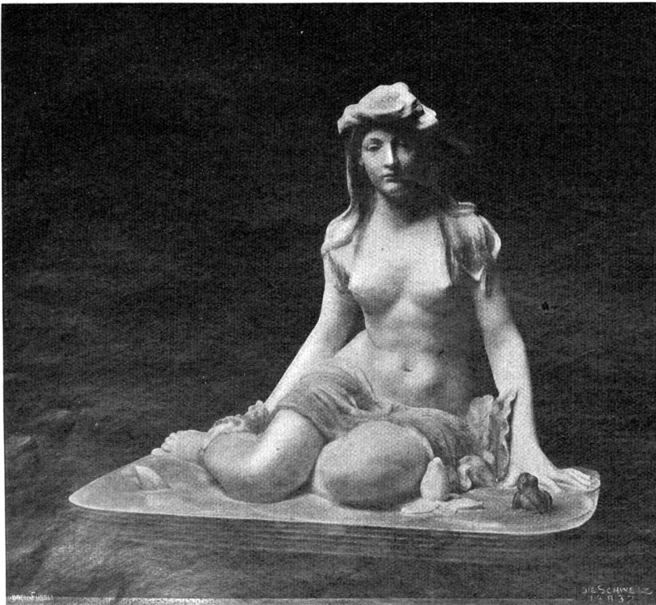
Seerose. Skulptur von Richard Kissling, Zürich.

glatt und kühl. Die Augenlider flirrten, um das Näschen huschte noch einmal ein Schattenspiel; dann lag es unbeweglich. Sie hielt es noch, hatte es noch im Arm, und doch — obwohl der Körper an ihrem Herzen lag, war ihr, als löste er sich unter ihren Händen langsam auf. Sie sprach kein Wort, weinte nicht, schluchzte nicht, gab ihm keinen Namen mehr; aber mit der innern Stimme sprach sie zu ihm: „Nun gehst du doch, willst nicht bei mir bleiben... Hast keine Mama mehr, brauchst auch keine mehr, gehst, wie du gekommen bist, ohne daß ich etwas dazu kann... Anne, Anne, mein Kleines-