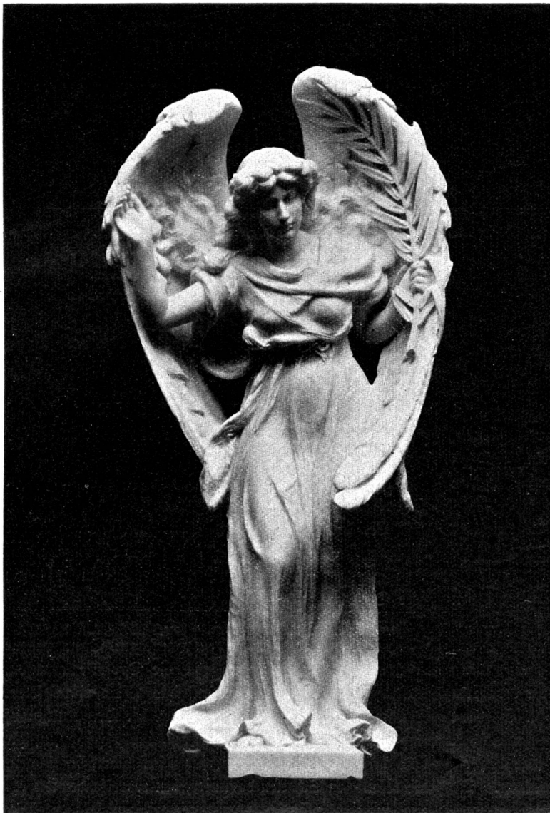
Grabdenkmal in Turgi (St. Margau) von Richard Kissling, Zürich.

und Nacht. Sie hatte gesorgt, gehofft, sie wollte es lieb haben, lieb bis zur Wut; aber es kehrte sich von ihr, scheu, ließ sich keine Zukunft bauen, wurde krank, sterbenskrank und schwand ihr unter den Händen weg. Sie hatte stolz getan, sich Mutter geheißen, sich vermessen ihr Kind durch alle Nöte und Demütigungen zu tragen, und es begehrte das gar nicht, wollte nicht liegen an ihrem Herzen, wollte sie wieder allein lassen, ganz allein. Eine Mutter ohne Kind!