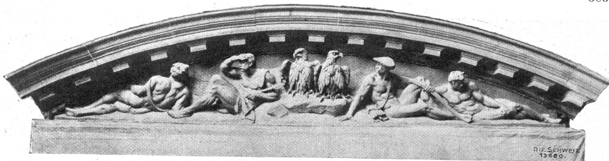
Wacht im Gebirg. Siebelgruppe von Richard Kissling, Zürich, an der Hauptkuppel des Bundeshauses in Bern.