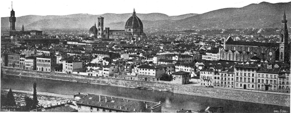
Panorama von Florenz, vom Monte alle Croci aus.