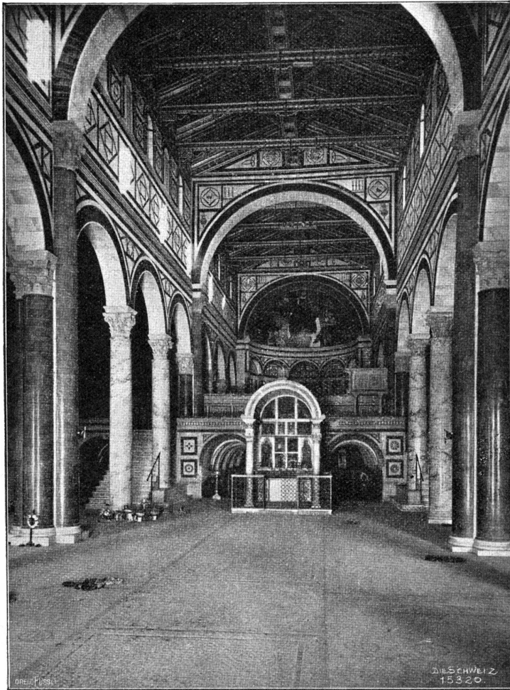
Inneres der Basilika S. Miniato al Monte bei Florenz.

So bannten die Alten das religiöse Gefühl in die Steine oder — besser gesagt — in die Form, in die sie diese Steine zwangen, und jeder, der sich dieser Macht hingibt, sich selbst in den gewaltigen Formen auslebend, der wird darin die reinste Kraft und das vollste Leben finden.