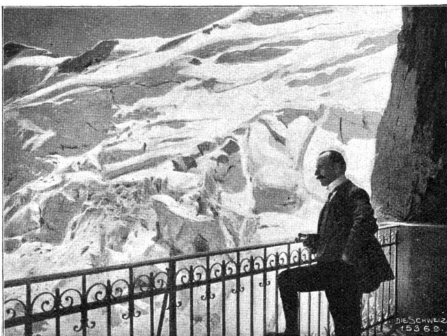
Ausblick von Station Eismeer auf den obern Grindelwaldgletscherfirn.