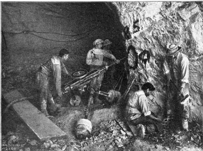
Im Jungfraubahntunnel. Die elektrische Gesteinsbohrmaschine in Tätigkeit (Phot. A. Krenn, Zürich).

Da bemerkte nach einiger Zeit die Frau Amtmann zu Hanna: „Heute kommt