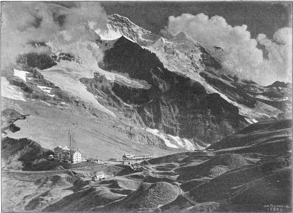
Kleine Scheidegg mit der Jungfrau (Phot. Anton Krenn, Zürich).

andere, da hab' ich aufgeschrien: „Nein, nein!“ Mein Entsetzen hat ihn stumm gemacht. Es ist doch nur die große, betörende Liebe gewesen, Erik, die dich ins Leben gerufen, da muß man auch die Folgen tragen . . . Er hat gewollt, daß die Verstellung mit lauter Lüge sich paarte: ich hab' auch das gelernt, alles um ihn, um deinen Vater, der ein so feiner vornehmer Mann ist und eine feine vornehme Frau und andere Kinder hat. . . . Meine Mutter, Erik . . . Ich weiß nicht, ich meine, eine Mutter müsse ihr einzig Kind doch in allen Lagen verstehen, auch in der Schande, und müsse zu ihm halten, wenn alle Welt es verläßt! Er aber sagt: „Nein, sie würde dich von der Schwelle jagen, du würdest sie ins Grab bringen!“ Er spricht von moralischen Verbrechen . . . Mein Kopf ist wirr, Erik; aber er, dein Vater, wird's wohl wissen, er ist so klug, so scharfsinnig; er kennt das Leben, oh, so genau kennt er es! . . . Und er kennt seine Stärke und der andern Schwäche. Nun will er das Größte und Schwerste, nun will er, daß ich dich lasse! Und weil ich so vieles um ihn gelernt, werd' ich auch das lernen müssen, hart und furchtbar, wie's mich auch ankommt. . . .“