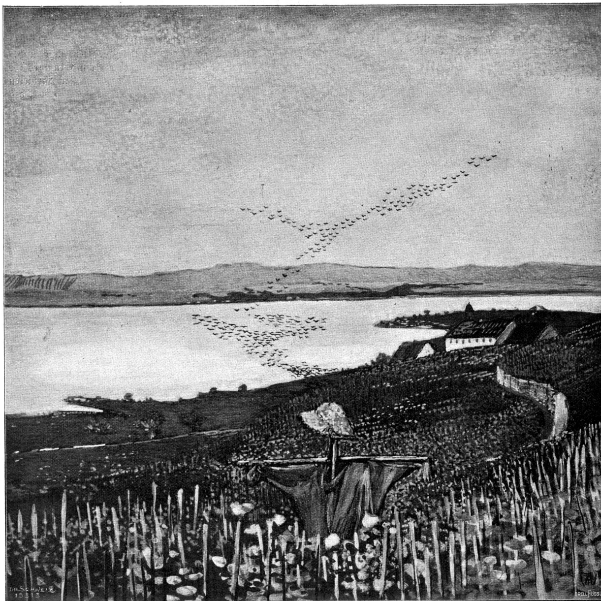
Starenflug. Nach dem Gemälde von Fritz Widmann, Bern-Milchstr. 10.