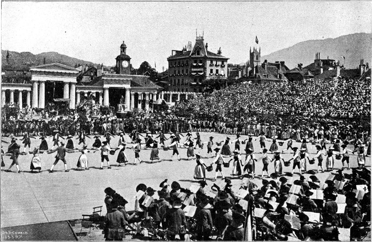
Vom Winzerfest in Vivis. Herbst. Winzertanz: «La Coquille».