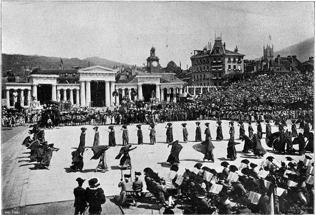
Vom Winterfest in Vivis. Herbst. Tanz der Kranephoren (Korbträgerinnen) und der « Feuilles mortes ».

Nous autres montagnards avons aussi nos fêtes, Le ciel bleu sur nos têtes, Fiers de nos fiers remparts. Nous autres montagnards.