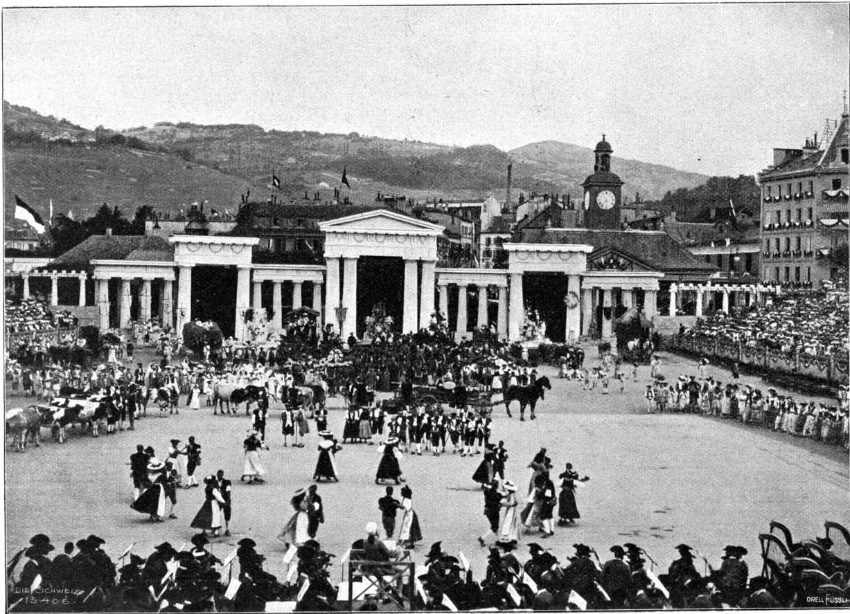
Vom Winterfest in Vivis. Sommer. Tanz der Sennen.

sich verändernden Himmel noch eine eigene Dramatisierung erfuhr, hat sich ganz besonders dramatisch dieser Augenblick gestaltet. Nach langem wechselvollem Kampf zwischen tapfer wehrhaften Fegern blauen Himmels und den nächtlich schwarzen Regenwolken hatten diese allmählich die Oberhand gewonnen. Einige seltene Tropfen fielen. Man sah es unvermeidlich kommen. Bis das Gewitter der Dichtung glücklich vorbei war, mußte das wirkliche gerade mit vollen Güßten da sein. Aber die Priesterin hatte den Dankeshymnus, dem man so grausamen Hohn beschieden meinte, noch nicht zu Ende gesungen — sie sang ihn strahlend und unbeirrt mit zuversichtvoller Glaubensstärke in die schwarze Decke hinein — da klärte es sich wieder, und als sie zu Ende kam, da stand sie mit all ihren glänzenden Scharen in einem Strom der goldensten Sonne, die aus offenem blauem Himmelsgrund in die schöne Menschenpracht herniederbrach, tausendfach wiederblitzend. Mit sieghafter Macht hatte die Diva die Regennacht fort- und die triumphierende liebe Sonne herausgesungen.