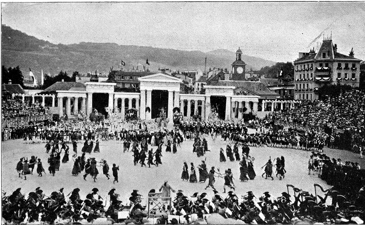
Vom Winterfest in Vivis. Herbst. Bacchantentanz.

und Grau, zwischen Grün und Braun, Gelb und Purpur, bringt in solcher ganzen, unerhörten Masse der Herbst nur in seinem ganzen langen Laufe hervor. Hier aber tanzt alles durcheinander, hier in grausamem Niesenwirbel und dort in launigen Seiten- und Einzelsprünge, jetzt in tollern, lustigen Feuergarben, in Schwärmen und Trüpplein, in langen Reigen und Girlanden und dann wieder in wehmütigem, langsamem Hinsinken, bis sie alle da und dort zerstreut verloren, todmüde liegen bleiben oder zu den Füßen der Kanephorengruppe in leiktem rührendem Todesflackern sich hinlegen — wie — eben wie welkes Laub: «Feuilles mortes»!