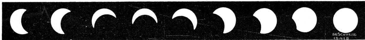
151 153 213 220 235 255 307 323 330 Die Sonnenfinsternis vom 30. August in verschiedenen Phasen mit Zeitangabe der Aufnahmen.