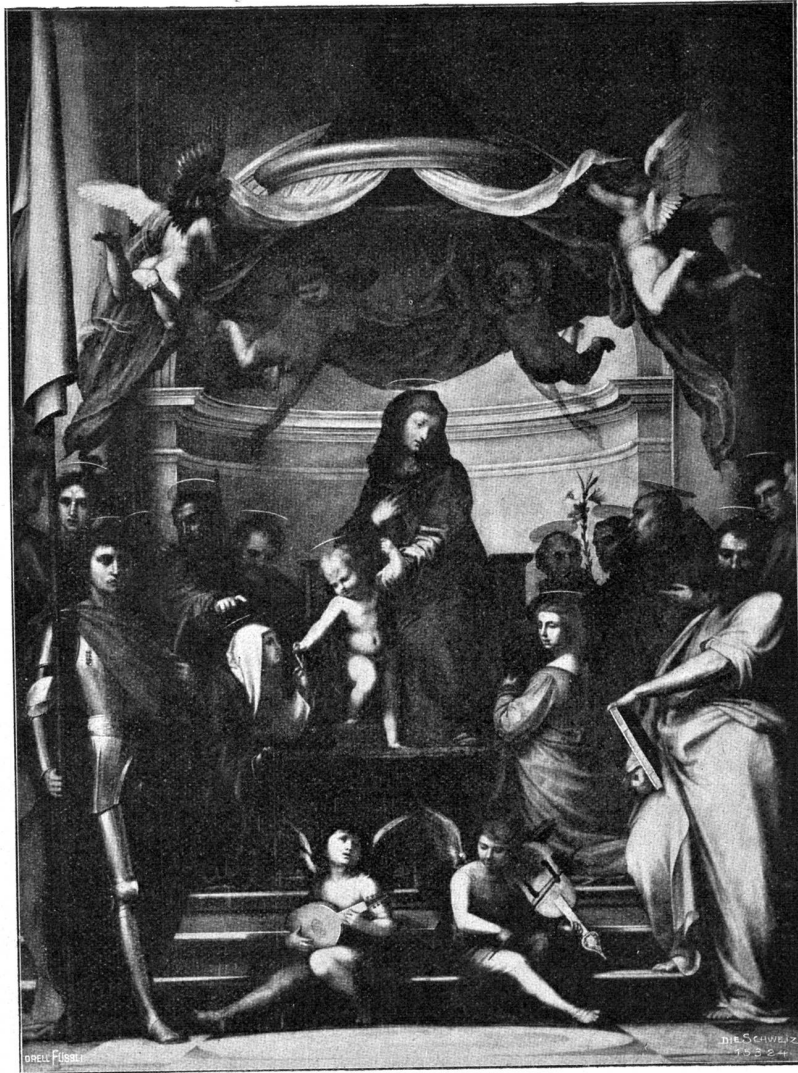
Die Verlobung der heiligen Katharina mit dem Christuskind.

Nach dem Gemälde von Fra Bartolommeo im Palazzo Pitti zu Florenz (Phot. Minari, Florenz).