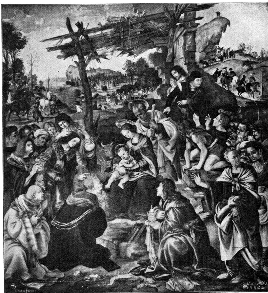
Anbetung der Könige. Nach dem Gemälde von Filippino Lippi in den Uffizien zu Florenz.

Man könnte sich fragen, warum ich unter letzter Kategorie nicht auch die Namen der Fra Bartolommeo und Andrea del Sarto anführe, deren Werke gerade ihrer Komposition wegen so berühmt sind. Die Antwort wird sich im Folgenden ergeben,