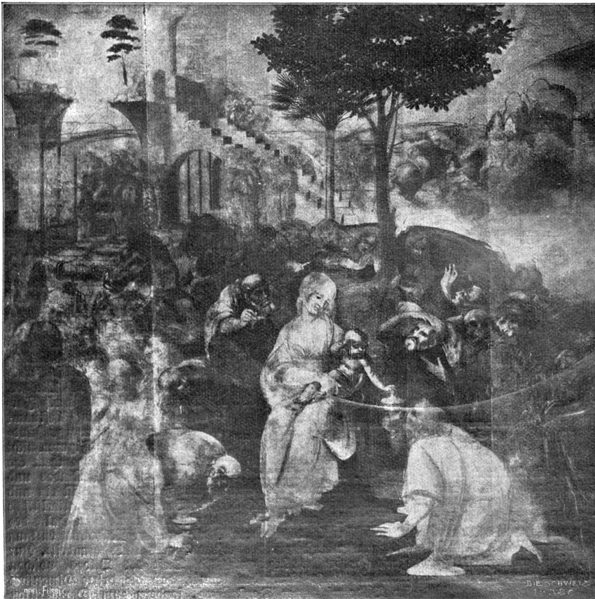
Anbetung der Krippe. Nach dem Karton von Leonardo da Vinci in den Uffizien zu Florenz (Bibl. Mediceo-Laurenziana, Florenz).

In die erste Kategorie, d. h. in die Kategorie der Bilder, deren Komposition zur Dienerin des stofflichen Inhaltes geworden, gehören etwa gewisse Werke der Fra