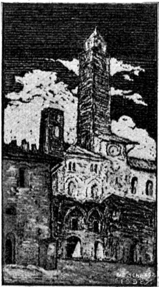
S. Gimignano. Torre del Comune.

des Bildes oder brechen unmotiviert, sinnlos ab. Die Komposition lehrt uns begreifen, warum dieses Bild trotz seinem symmetrischen Aufbau und angenehmen stofflichen Inhalt auf die Dauer einen so unharmonischen und mühsamen Eindruck macht, und weil diese Komposition für fast alle Bilder des Mönchs typisch ist, begreifen wir, warum die Werke Fra Bartolommeos ein so langames, lebloses und schweres Wesen an sich haben, und zwar auch dann, wenn sie im Gegensatz zu vorliegendem Bilde ein reichbewegtes Leben zur Darstellung bringen, wie dies z. B. in der Freske des jüngsten Gerichtes der Fall ist.