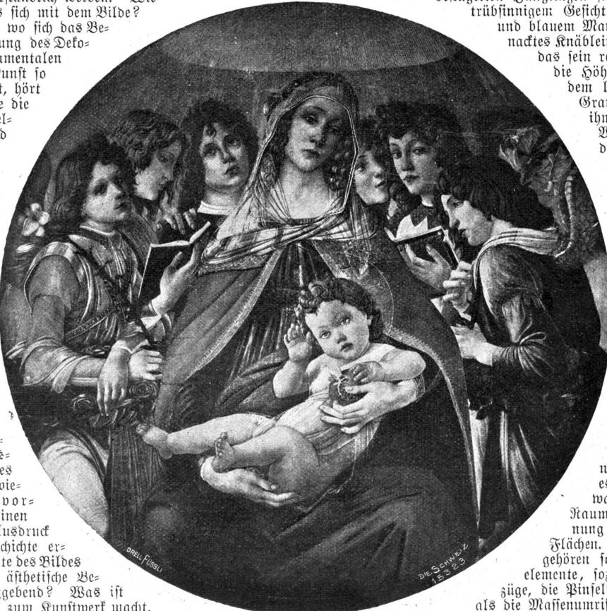
Madonna mit dem Granatapfel.

Betrachten wir einmal Botticellis berühmten Tondo aus den Uffizien, die „Madonna mit dem Granatapfel“. Was wir hier in erster Linie sehen, ist dies: im Kreise von sechs beflügelten Jünglingen sitzt eine Frau mit trübfinnigem Gesicht in rotem Kleide und blauem Mantel; sie hält ein nacktes Knäblein auf dem Schoße, das sein rechtes Händchen in die Höhe streckt und mit dem linken nach einem Granatapfel greift, den ihm die Frau reicht.