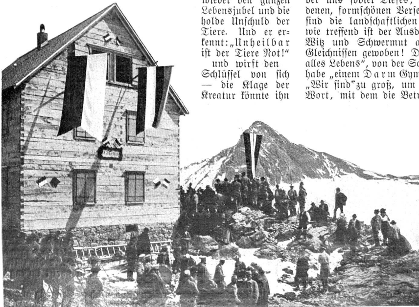
Einweihung der Straßburger Hütte am Brandnerferner; rechts der Gipfel der Seefaplana (2969 M.).

wieder den ganzen Lebensjubiläum und die holde Unschuld der Tiere. Und er erkennt: „Unheilbar ist der Tiere Not!“ und wirft den Schlüssel von sich — die Klage der Kreatur könnte ihn