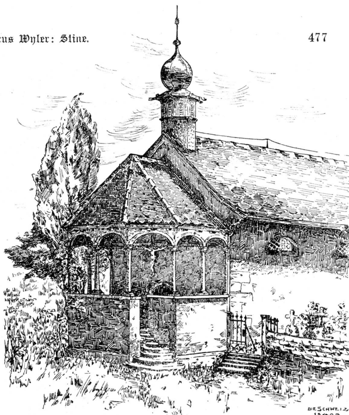
Dreibrunnen bei Wil, Rt. St. Gallen. Nach Federzeichnung von Helene Borler, Zürich.

Als sie wieder zu sich kam, war sie allein. Waldemar aber geht nach Hause und schreibt zwei Abschiedsbriefe. Einen