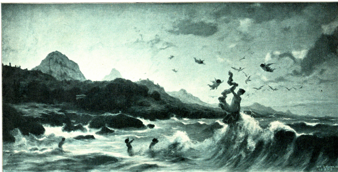
Die Geburt der Venus. Nach dem Gemälde von Emile David (1824—1891) im Musée Rath zu Genf.