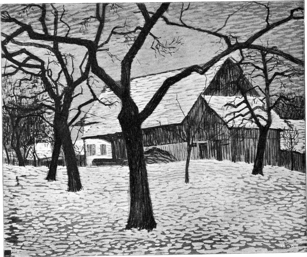
Winterlandschaft. Nach dem Gemälde von Carl Montag, Winterthur-Paris.

nicht zu helfen wußte, wandte ich mich an den freundlichen Ratgeber aller Armen im Geiste, und im Konversationslexikon fand ich das Gesuchte. Wie war ich aber bestürzt, als ich dort vernahm, daß Dante ein Mann und Beatrice seine Geliebte sei! Also Herr Schwarzmann hatte mir ein Liebespaar geschickt. Ich fand das ein wenig gräßlich, aber doch ungeheuer interessant, und ich freute und schämte mich abwechselnd. Am selben Neujahrmorgen noch besuchte mich meine Freundin, erzählte gleichgültige Dinge, aber machte dazu so gehemnisvoll glückliche Augen, daß ich ihr gleich anmerkte, warum sie kam. Der Inhalt ihrer Karte, die sie bei sich hatte, wies uns wiederum ans Konversationslexikon. Ihr Bildchen stellte nämlich ein sehr