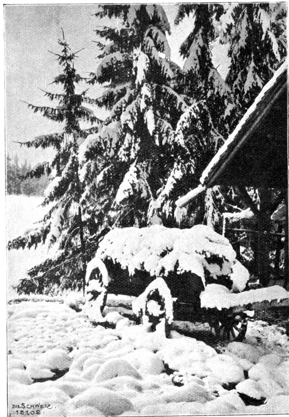
Verfchneit (Motiv vom Zürichberg).

Die Weiber nicken zurück; auch in dem Nicken liegt es: Heute ist es einmal recht gegangen!