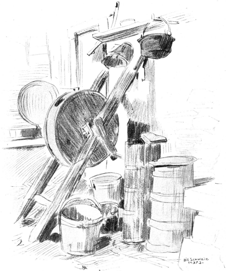
Aus einem Skizzenbuch von Jacques Ruch, Schwanden-Paris.

„Als ob heute nicht schon mancher vorbeigefahren wäre!“ lacht die Püntinerin. (Fortsetzung folgt).