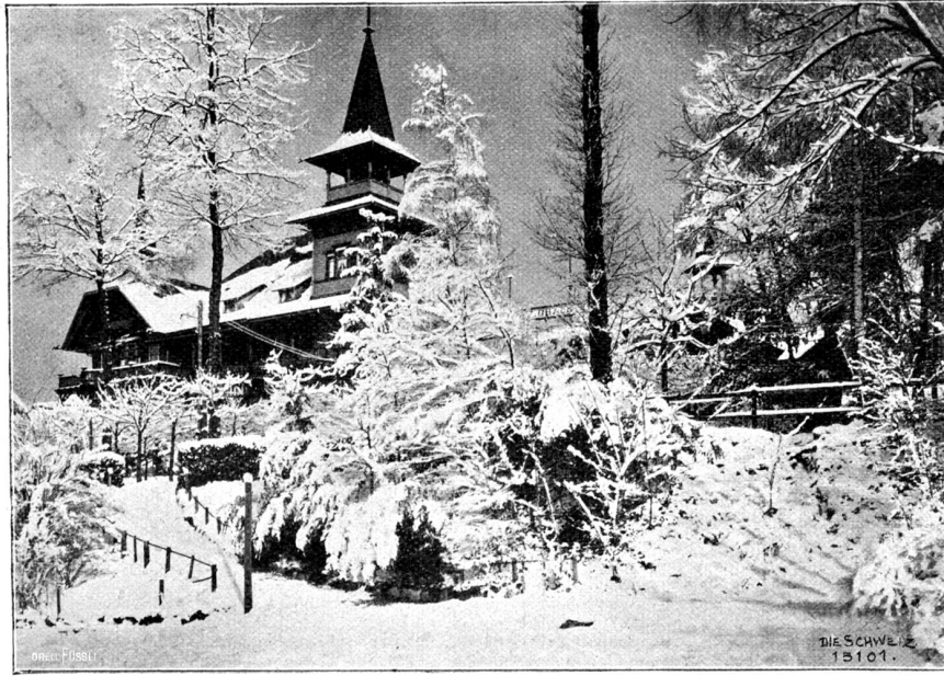
Wintermotiv (Waldhaus Dolber bei Zürich).

Ein wackliges Haupt, würde sie lächeln. Der Ratsherr, ihr Mann, ist tot; das ist jetzt schon fünfzehn Jahre her. Die Püntinerin ist selber schon sechzig.