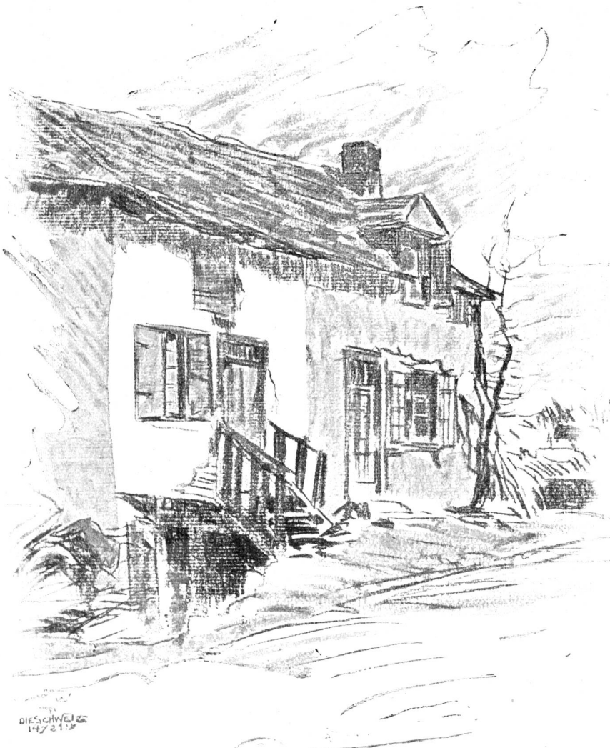
Aus einem Skizzenbuch von Jacques Ruch, Schwanden-Paris.

In der niedern Stube, die mit den langen Fensterreihen zweier Wände auf Matte und Gartenland und weiterhin gegen Altburg hinauf sieht, sitzen nachher der Arnold, die Püntinerin und die Elisabeth beisammen und warten auf den neuen Landrat, den Vincenz. Sie sitzen um den runden Tisch, über dem, noch unangezündet, die Lampe an der getäfelten Diele hängt, der Arnold in Hemdärmeln,