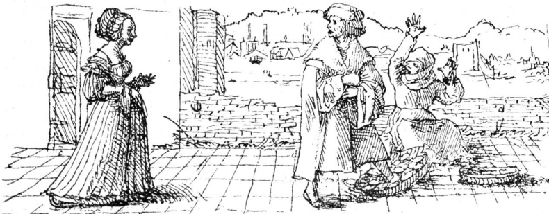
Hans Holbein d. J. Federzeichnung aus dem „Lob der Nartheit“ (Dissimulata stultitia).

Im Jahr 1532 verließ Holbein Basel, um sich bleibend in England niederzulassen, trotz eines Anerbietens des Rates, ihm eine Pension auszusetzen und ihn mit seinen Kunstwerken reifen zu lassen. Anlässlich eines Besuches im Jahr 1538, bei dem des Künstlers Ankunft durch ein Festessen in der „Mädg“ gefeiert wurde, erneuerte der Rat von Basel sein Angebot. Aber Holbeins Ruhm stand in England so hoch, seine Stellung war so angesehen und von den Höchsten im Lande anerkannt, daß er den ehrenvollen Angeboten der Heimat kein Gehör schenken konnte. Er war der bevorzugte Porträtmaler des königlichen Hofes und der hohen englischen Aristokratie; er gelangte, wie hundert Jahre später Van Dyck, durch die Ähnlichkeit der ihm gewordenen Aufträge zu einer an Manierismus grenzenden, aber stets bestechenden Ausdrucksweise. Mit Verzichtleistung auf den momentanen Ausdruck hält er die Züge des Gesichtes ruhend fest und erreicht dabei trotz starker Beto-