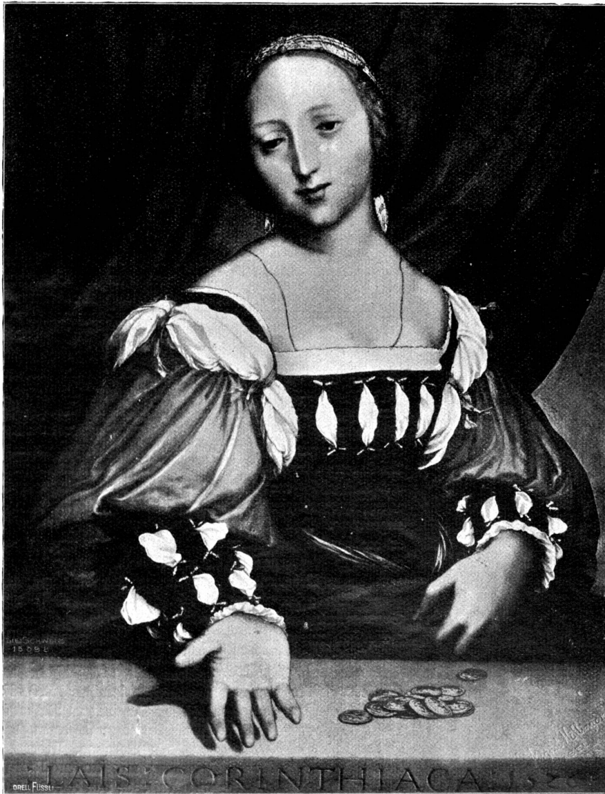
Hans Holbein d. J. Bildnis der Dorothea von Offenburg als Lais von Korinth (1526) in der öffentlichen Kunstsammlung zu Basel.