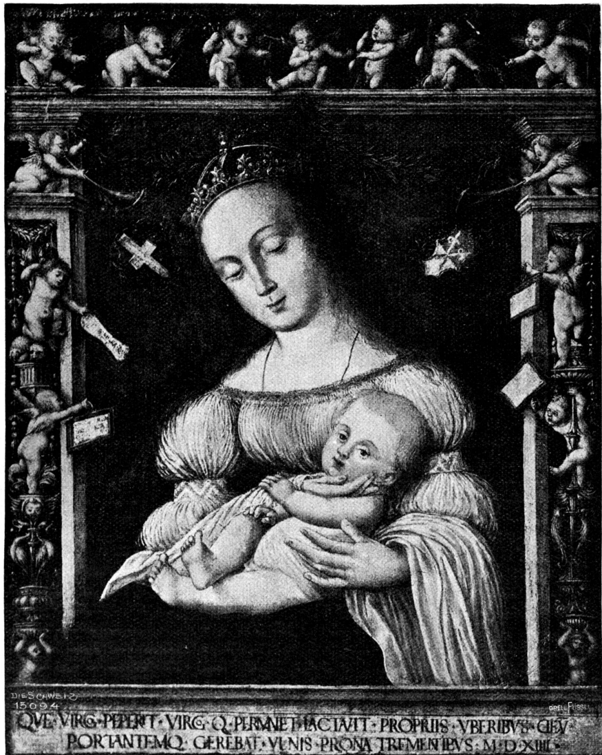
Hans Holbein d. J. Madonna mit Kind (1514) in der öffentlichen Kunstsammlung zu Basel.

gemälde einen höhern, künstlerischen Wert durch die Vereinfachung der Darstellung, einen geschlossenen Architekturrahmen und eine feinere Verteilung der Farben. Im Vergleich mit den gleichzeitigen Arbeiten Niklaus Manuels und des Urs Graf tritt die Ueberlegenheit Holbeins in dem organischen Aufbau und in der klaren Durchbildung der neuen Formen zutage. Der nüchterne Verstand spricht aus allen seinen Werken, und der auf Formenreinheit gerichtete Sinn schafft eine Komposition, in der das geringste Detail berücksichtigt und im Verhältnis zum Ganzen abgewogen wird. Er begann mit einfachen Problemen, mit einem rundbogigen Säulenportal, durch dessen Oeffnung die Darstellung sichtbar ist (Seite 140); er erweiterte den Rahmen zu einem monumentalen Prachtbau mit Tonnengewölbe und reicher plastischer Ausschmückung (S. 127) und verband schließlich die Architektur mit den Figuren zu einem unteilbaren Ganzen (Seite 131).