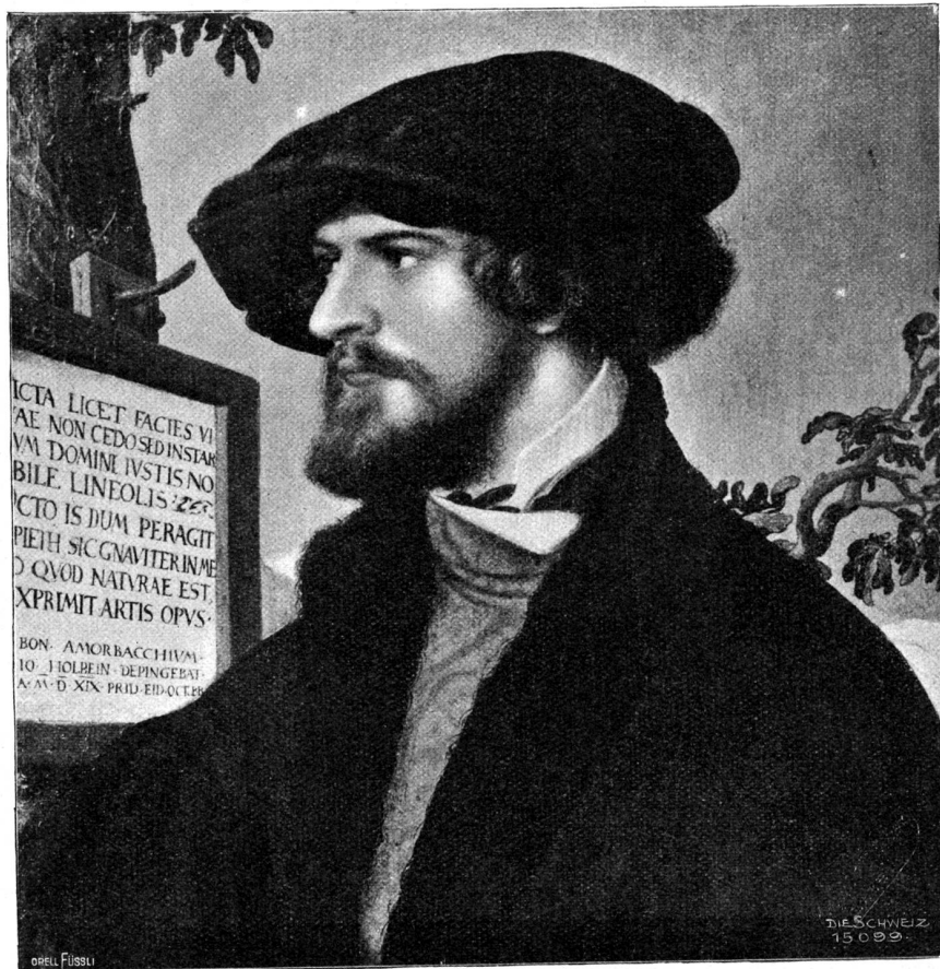
Hans Holbein d. J. Bildnis des Rechtsgelehrten Bonifazius Amerbach (1519) in der öffentlichen Kunstsammlung zu Basel.

Durch die politischen Umänderungen in Basel wurden die nächsten Gönner Holbeins aus Amt und Würde gedrängt, der Kreis des Bürgermeisters Jakob Meyer gehörte zu den Altgläubigen, und Holbein sah sich deshalb gezwungen, sein Verdienst auswärtig zu suchen. Der Plan einer Reise nach England, schon 1524 erwogen und durch Empfehlungsschreiben des Erasmus an Thomas Morus, den englischen Staatsmann und an Petrus Aegidius in Antwerpen vorbereitet, wurde im Lauf des Jahres 1526 ausgeführt. „Hier frieren die Künste,“ stand in dem Brief, den Holbein nach Antwerpen mitnahm. In Antwerpen besuchte Holbein das Atelier des Quentin Metsys und soll dort das Bildnis des Petrus Aegidius gemalt haben. Da er auf Gelderwerb ausgehen