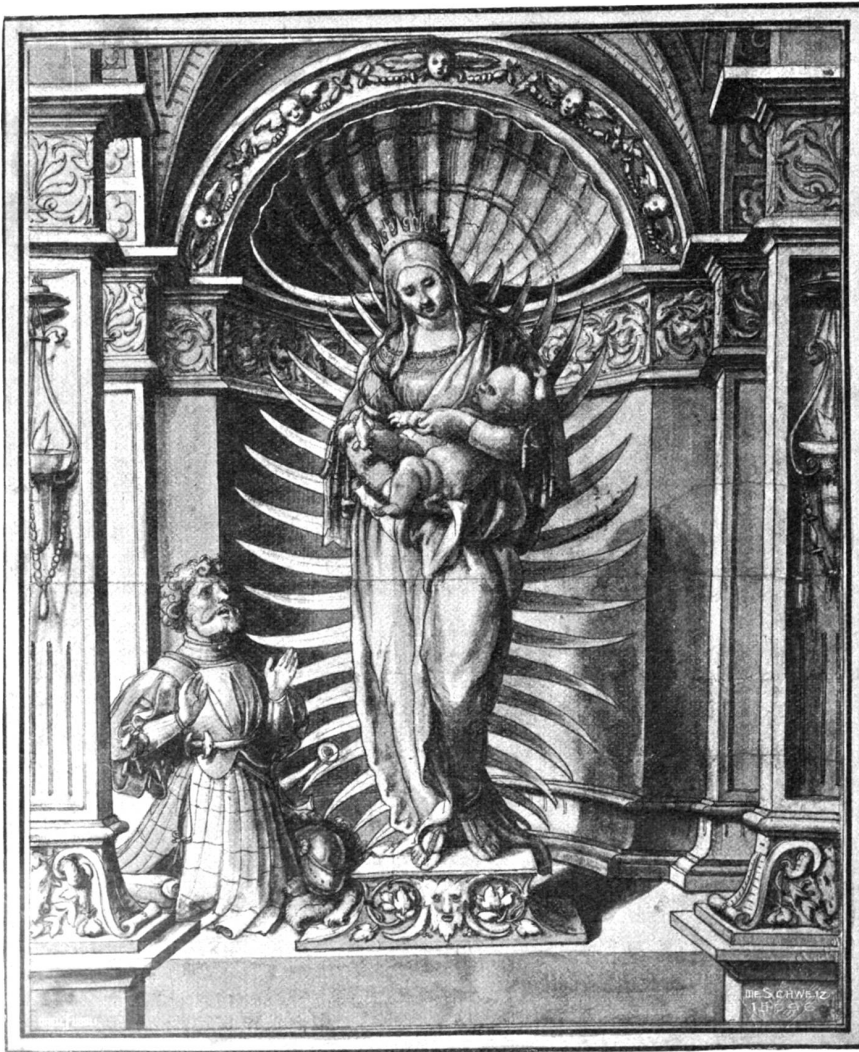
Hans Holbein d. J. Madonna in Glorie mit Stifter, in der Oeffentlichen Kunstsammlung zu Basel.

Zwei Altarflügel mit der Passion Christi in acht Szenen (Seite 122) bildeten ursprünglich mit dem Bilde des Abendmahls einen dreiteiligen Altarschrein. Sie zeigen dieselbe symmetrische Anlage bei malerischer Gruppierung im einzelnen Felde. Zwei Mittelfelder sind je weilen durch eine gemeinsame Aktion miteinander verbunden und durch die starken Vertikallinien der Kreuze, des Baumes und der Architekturen hervorgehoben. Die äußern Felder korrespondieren in der Diagonale, die beiden Darstellungen im Freien wirken stark koloristisch, die Szenen im Innenraum, Christi Geißelung und Dornenkrönung erhalten