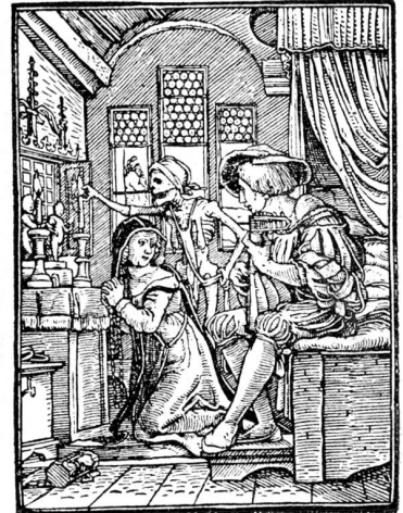
Holzschnitt aus Holbeins Totentanz „Die Nonne“.