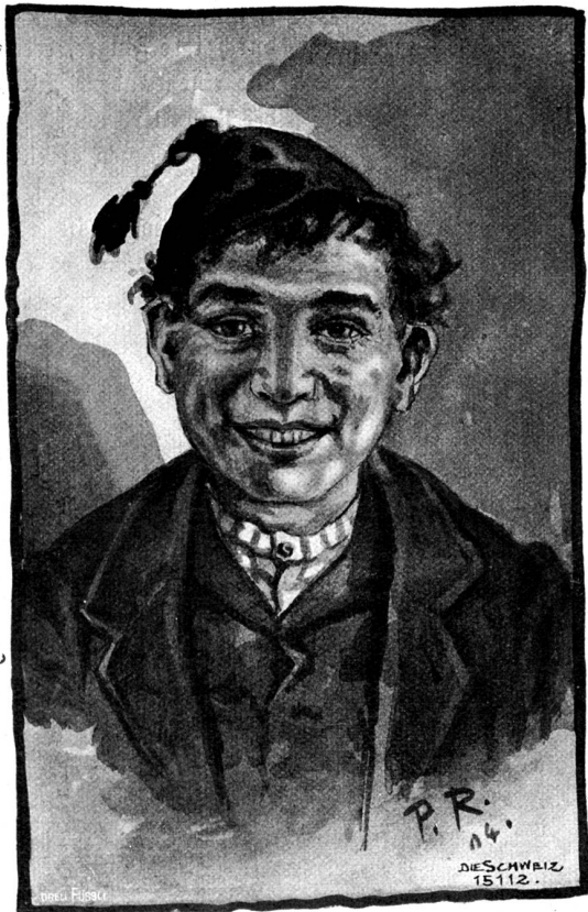
Geißbub. Nach Sepiazzeichnung von Paul Kuettsch, Suhr.

hereinschlagen, während der Kiel sie stöhnend schneidet und übersteigt. Weiter vorn ist nichts als Dunkelheit; aber der Püntiner kennt die Richtung, steht aufrecht und rudert. Die Stangen knarren, so tief taucht er sie ein. Wenn eine Welle sich an die Seitenplanken des Schiffes wirft, neigt es sich vor ihr ein-, zweimal schwankt der Ruderer; aber er arbeitet sich auf und steht wieder fest; denn er will nicht nachhelfen, wenn der See ihn nicht will. Meistern soll ihn der Tod; verschenken tut er sich nicht; denn er ist nicht feig. Kommt er über den See, gut, soll es ein andermal sein! Er wird nur immer da stehen, wo das Leben