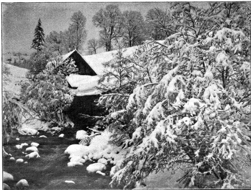
Sägemühle an der Lüttschine.

„Der Vincenz, gestern morgen, als ich fort bin!“