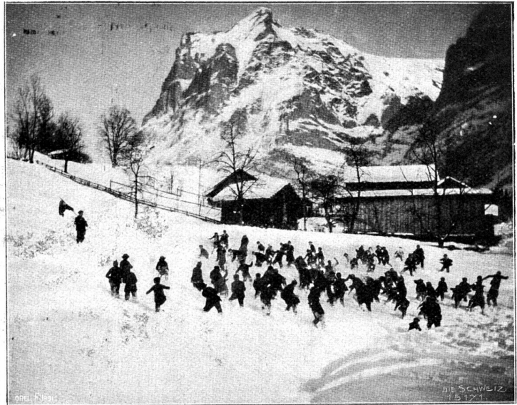
Schneeballschlacht (im Hintergrund das Wetterhorn).

„Der Vincenz?“ sagt die Elisabeth. Dann springt ihr das Wasser in die Augen. Da merkt der andere erst, daß etwas nicht recht ist in der Stube. Er will fragen; aber die Elisabeth wehrt ihm leise, mit einem Blick auf die Mutter.