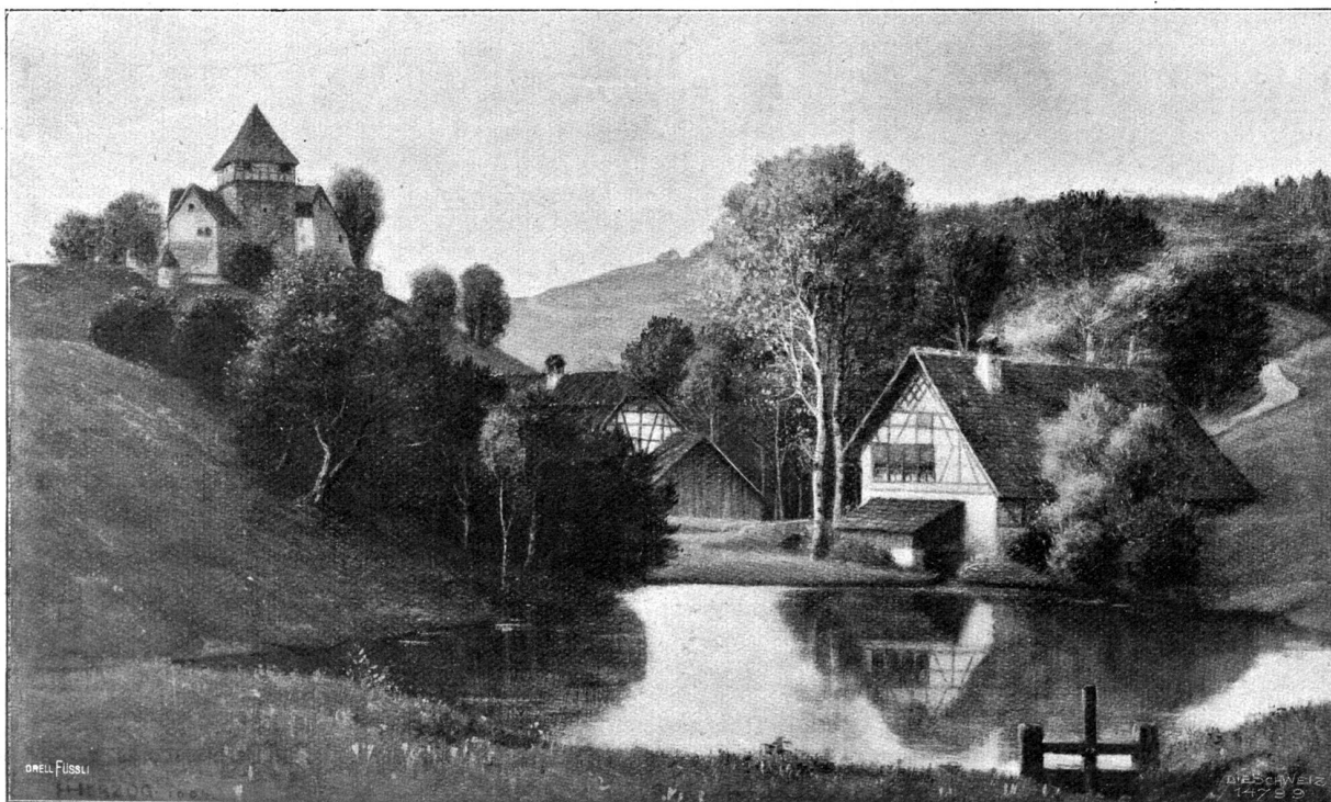
Schloß Wyden und Mühle Offingen. Nach dem Gemälde von Jakob Herzog, Winterthur-München.

Es wurde ein sehr gemütlicher Abend. Nichts Fremdes stand zwischen ihnen, und Hildes große, alles Häßliche und Harte abweisende Jugend legte sich wie ein frischer Hauch auf die Seele der Männer, sodaß ihre Gedanken