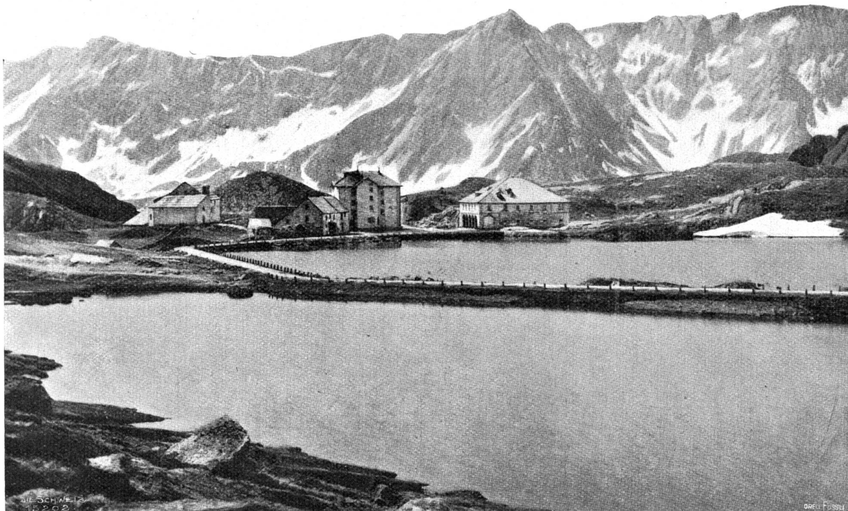
Das Gotthardhospiz (vom 9. auf den 10. März abgebrannt).

„Die Worte ja, die sind von Heine; aber die Melodie kenne ich nicht.“