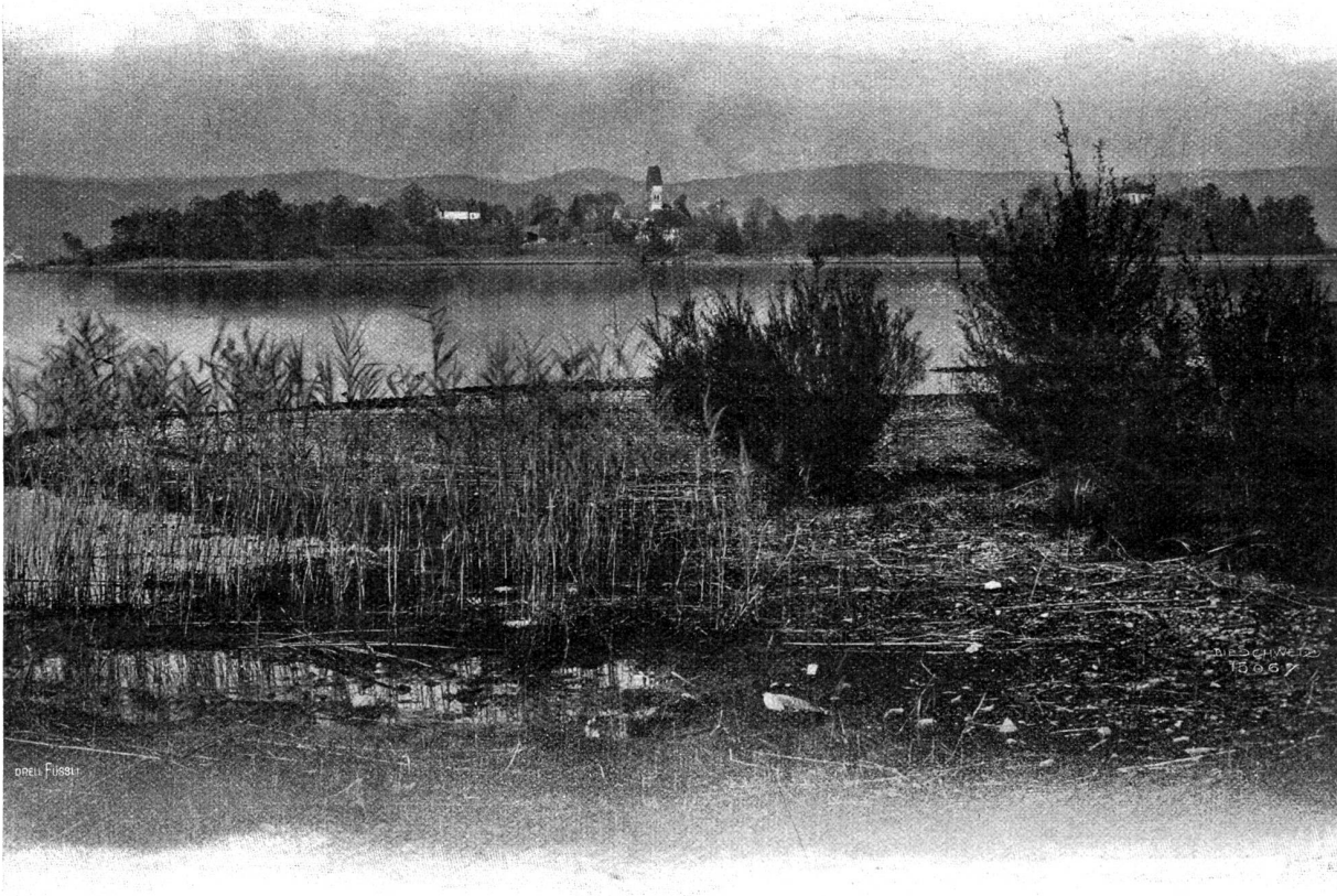
Die Ufenau, von Pfäffikon aus gesehen.

hervorgebracht hat. Sie gibt diesem Ton klassische Vollendung. Beispiel: