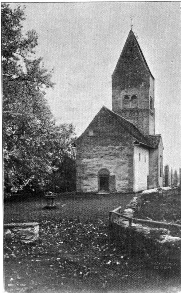
Kirchlein auf der Ufenau; davor der sog. „Guttenstein“.