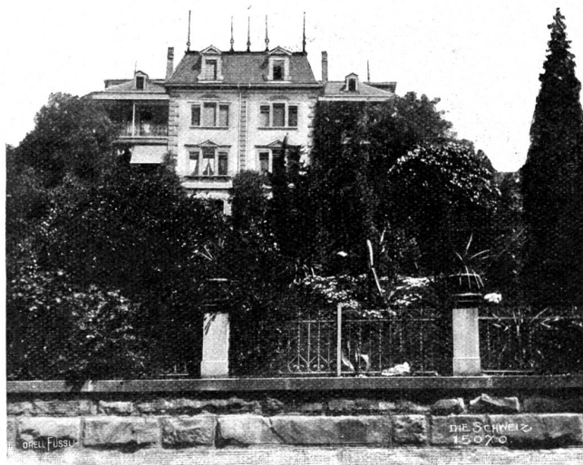
Carl Spitteler's Villa bei Lugern.

Das Wort des treuen Erdgeistes im zweiten Gesang der „Hohen Zeit“ überrascht bei Spitteler nicht. Es ist für den psychologischen Reiz seiner Dichtung nur kennzeichnend: