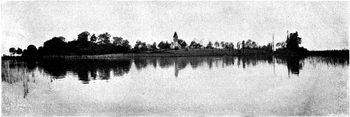
Die Afenau, von der Lüzgau aus gesehen.

Ihr seligen Olympier, edle Frau und Herrn, Den Unterird'schen bleibt mit eurem Reckmut fern! Genug, daß ihr die Welt mit Luft und Lärm betäubt, Den Lufteraum segt, der Erde Oberfläche stäubt! Doch innen munkeln dunkle Dinge allerhand, Die liegen außer eurem sonnigen Verstand. Und geißelt nicht den Grund und schändet nicht das Brot; Denn Tränen kleben dran, gepreßt aus heiliger Not.