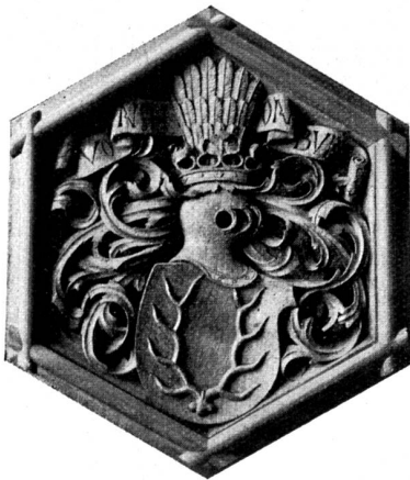
Medaillon von einer Holzdecke aus Schloß Urbon (St. Thurgau) im Schweiz. Landesmuseum zu Zürich.

nannten wir unsern Wunsch nach einem Kalender, der ein dauerndes Gut, eine Art von Freund würde. Denn, könnten wir das dabei nicht auch haben? Sind nicht Herrlichkeiten genug vorhanden im Vermächtnis unserer Geschichte? Gehobene und ungehobene Schätze — manches, das jetzt gepflegt und gehalten wird wie ein neu entdecktes Heiligtum — anderes, das hat weichen müssen vor der neuen Zeit oder doch weichen muß demnächst und um so dringender Anspruch hat, festgehalten zu werden!