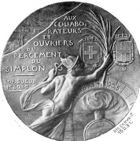
Vorderseite der Simplonmedaille von Hans Frei, Basel.