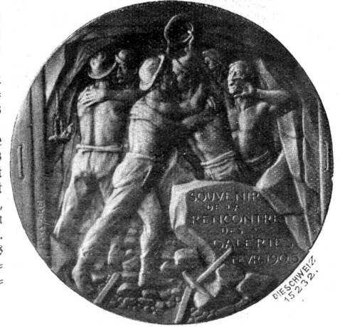
Rückseite der Simplonmedaille von Hans Frei, Basel.