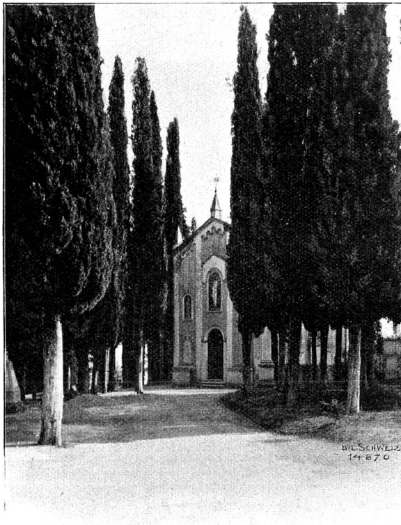
Beinhaus und Gräberfeld von San Martino, ersteres mit den Skeletten von 2619 gefallenen Piemontesen.