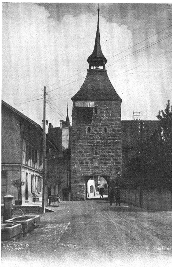
Der alte Torturm in Büren.

her und her und hin, immer näher und näher. Da war es mir, die Haut hob sich von der Frage im Spiegel, und ein Totenschädel starrte mir entgegen, und der grinste und nickte und nickte und grinste und schien zu sagen: Nur zu!