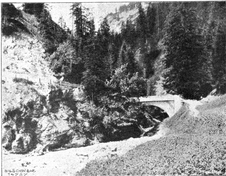
Brücke über den Allenbach.

Anlässlich des Teltjubiläums wurden die Leser der „Schweiz“ mit einer Reihe von Teldramen vor und nach Schiller bekannt gemacht 1) . Wir möchten nun nicht unterlassen, noch eines Telschauspiels zu gedenken, das für uns Schweizer von besonderem Interesse sein muß, weil es von einem Schweizer gedichtet wurde, weil es die Tendenzdichtung eines politischen Märtyrers ist und weil es als solche die Reihe der Teldramen des achtzehnten Jahrhunderts eröffnet hat. Wir meinen die Teldichtung des unglücklichen Berners Samuel Henzi.