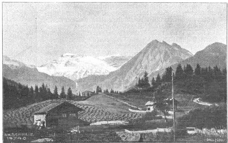
Auf dem Weg nach dem „Boden“. Blick auf Wildstrubel, Tizer und Höchi.

„Siehst du, Papa, hier habe ich ein Haus gebaut. Weißt du, es ist ein so großes, schönes, wie der Herr Doktor eins