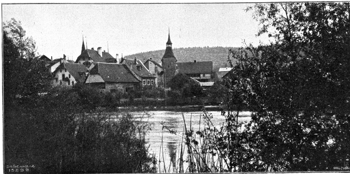
Büren an der Aare.