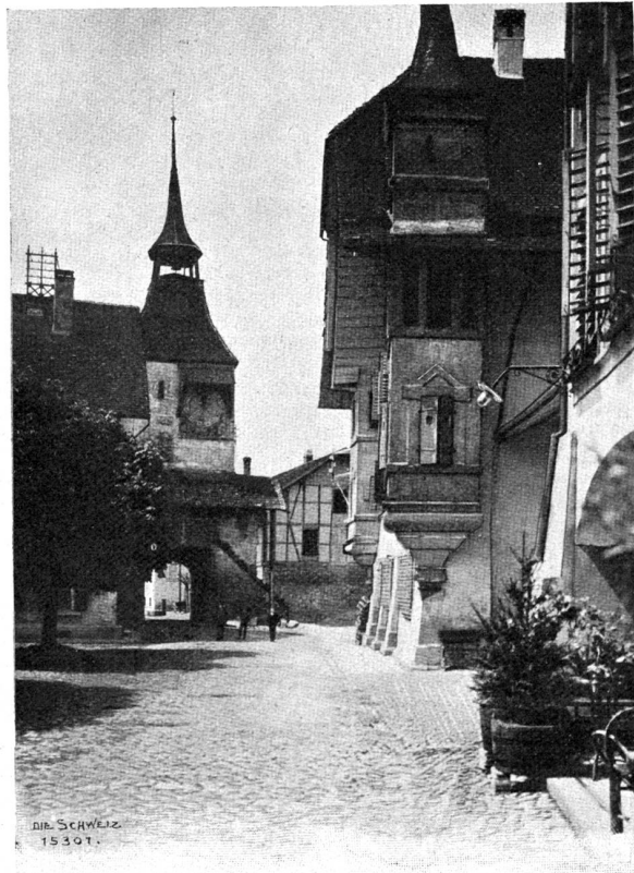
Torturm und Gemeindehaus in Büren.

Heute abend aber, da wollte ich hereinbrechen wie das