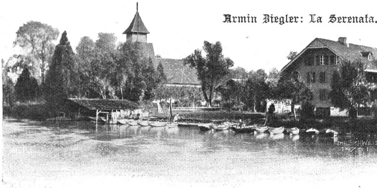
Scherzigen am Thunersee.

jüngste Gericht; die Strafe — was für eine mußte ich nie — aber Strafe sollte über sie kommen, wie die Wellen über das lecke Wrack!