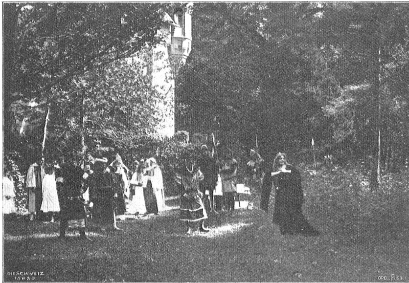
Das Spiel von Hallwyl. Atlas Glück.

Stammstübe — gerade um seiner Abgelegenheit und Stille willen. So die Grafen von Hallwyl.