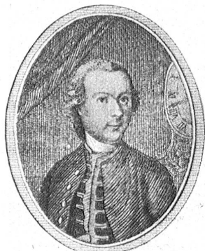
Pierre Jaquet-Droz (1721-1786)

Wir wenden uns nun der Glanznummer zu, der sogenannten Pianistin. Früher soll sie ein Spinett gespielt haben, das aber ein weniger zähes Leben als sie selbst hatte und durch eine Art Harmonium ersetzt wurde, auf dem sie fingerfertig fünf Melodien vortragen kann. Dabei hebt und senkt sich ihre Brust vor Begeisterung, sie himmelt entzückt und macht ihr Kompliment, wenn sie fertig ist. Diesen gestanden: schön ist's nicht; aber, wie mir mein Nachbar lächelnd sagte, die Neuenburger waren im achtzehnten Jahrhundert noch unmusiklischer als heute, und so wollen wir wenigstens die Gewandtheit und Taktfestig-