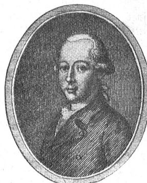
Henri-Louis Jaquet-Droz (1752-1791)