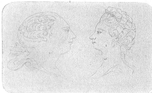
Ludwig XVI. und Marie Antoinette.