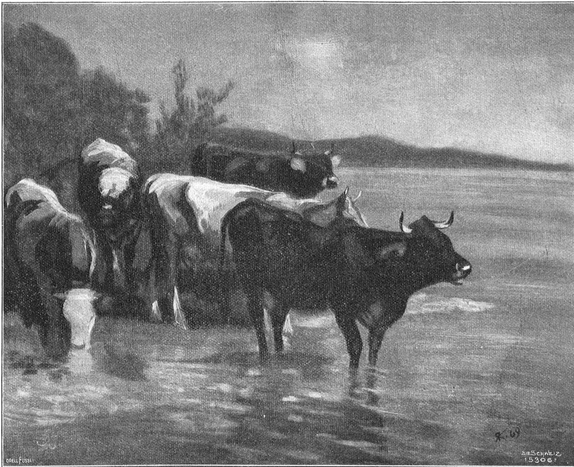
Kühe am Zürichhorn. Nach einer Vellfisse (1863) von Rudolf Koller (1828—1905).

Bette seinen Mausch ausschließ, war es ihm eingefallen rauchen zu wollen. Er stand auf und wankte zum großen offenen Herd, auf dem ein mächtiges Feuer brannte; aber zu betrunken, um stehen zu können, kam er ins Wanken und fiel in die Flammen. Als die Seinigen heimkehrten, fanden sie nur noch die Gebeine ihres Hirten vor.