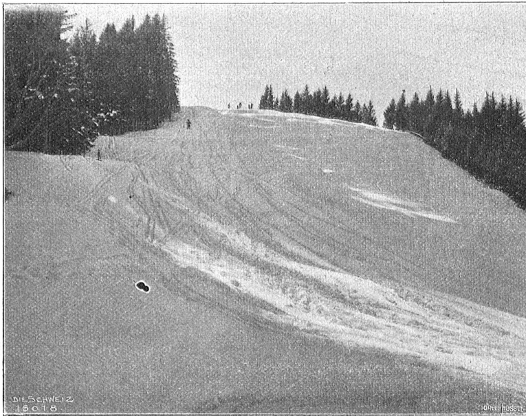
Am Freiherrenberg bei Sinfiedeln.

Außerordentlich fein ist die Betrachtung über Sokrates als Bildhauer, befreiend wirkt die genußfrohe Würdigung von Raffaels Jarnesina-Bildern, Amor und Psyche Geschichte, «Le sourire de Rome». Es tut gut, daran erinnert zu werden, daß die tragische Stadt auch ihr Lächeln hat. „Ja, ist jetzt das alles?“ jagt ein wohlgekleideter alter Herr mit Orden zum Hüter. „Das ist den Franken fürwahr nicht wert!“ Die Bananen und der Pöbel unter den Rompilgern werden diskret, aber deutlich gewürdigt in unserem Büchlein, und der snob voyageur, qui ne voit Rome qu'à travers les hôtels à ascenseur et les glaces de son landau, und der die herrlichen echten Wirtschaftserlebnisse nicht kennt. Es kann nicht genug wiederholt werden, gerade diese betreffend, daß man das Bündchen in der Tasche behalten soll. Man ist wundervoll aufgehoben auf seinen Pfaden.