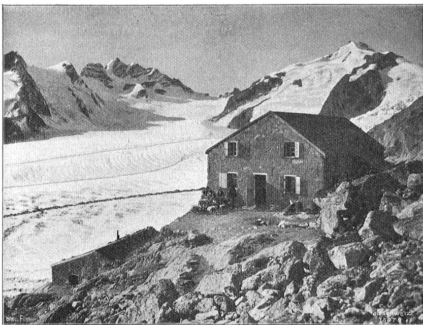
Konkordiahütte mit Jungfrau und Trugberg.

bilden weiß. Man lese nach, wie er den Hermes des Praxiteles beschreibt!