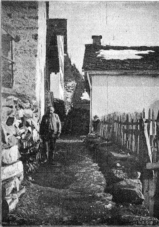
Dorfbild aus Altanca.

zugswise Kaffeebüchse und Kartoffeln, stillen muß! Unter solchen Verhältnissen verdiente die Ziege wirklich als „Muh des armen Mannes“ eine weitere Verbreitung und vor allem auch da, wo sie gehalten wird, eine bessere Pflege; denn so zahlreich sie in gewissen Bergkantonen und in gewissen Distrikten auf dem Lande gehalten werden mag, so ist sie, was sachgemäße Züchtung und Behandlung anlangt, neben dem Gesäugel entschieden das am meisten vernachlässigte Haustier. Da man sie in unserer zünftigen Landwirtschaft nicht mehr für so recht voll ansieht, so ist im ganzen den armen Leuten überlassen, die ihr in schlecht besorgtem, meist zu engem Stall bei kärgem Futter eine jämmerliche oder, besser gesagt, meist gar keine Pflege angedeihen lassen, so ist es kein Wunder, daß aus dem so überaus geschätzten Milchtiere der Vorzeit eine fast sprichwörtlich „magere Ziege“ geworden ist, deren Haltung wegen der inbezug auf Menge und Qualität vielfach minderwertigen Milch kaum mehr lohnt. Um so verdienstlicher ist es, daß seit einigen Jahren besonders im Ausland landwirtschaftliche und industrielle Kreise, auch Ärzte, die sich mit der Behandlung zehrender Krankheiten, speziell der Tuberkulose befassen, die Bedeutung der Ziege für das Volkswohl erkannt und ihre Verbesserung energisch an die Hand genommen haben.