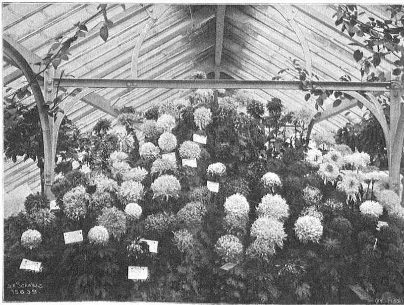
Schweiz, Versuchsanstalt für Obst-, Wein- und Gartenbau. Chrysanthemenausstellung im Gewächshaus.

Er zeichnete sie entschieden aus, der schmucke Bubenbesitzer, erkundigte sich aber auch unter der Hand im Dorfe nach ihr. Die Erkundigungen fielen gut aus: ein fleißiges Mädchen, sagte man, das solid ist und den Lohn nicht vertut. Ein Glücksbudenbesitzer, der kein eigen Haus hat und nichts als sein Glücksrad und die paar Stangen, aus denen seine Bude besteht, sein eigen