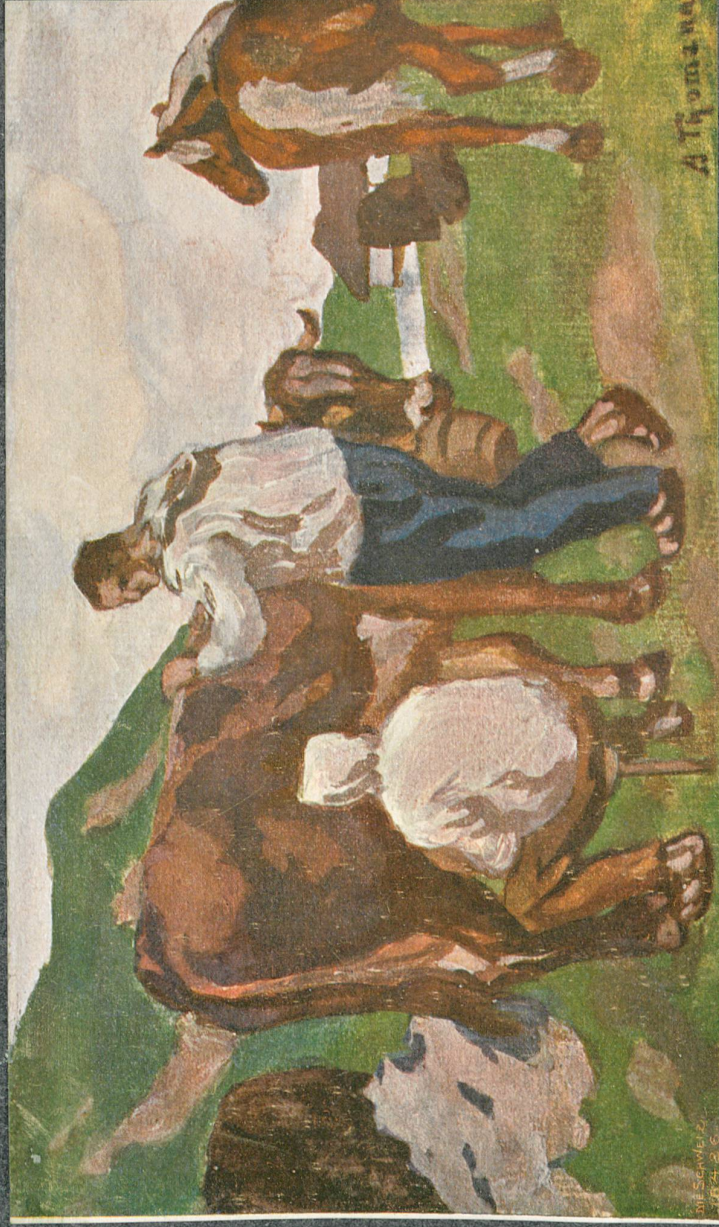
Der Melker. Nach Jodliger Skizze (in Vollerempere), von Adolf Chytrý.