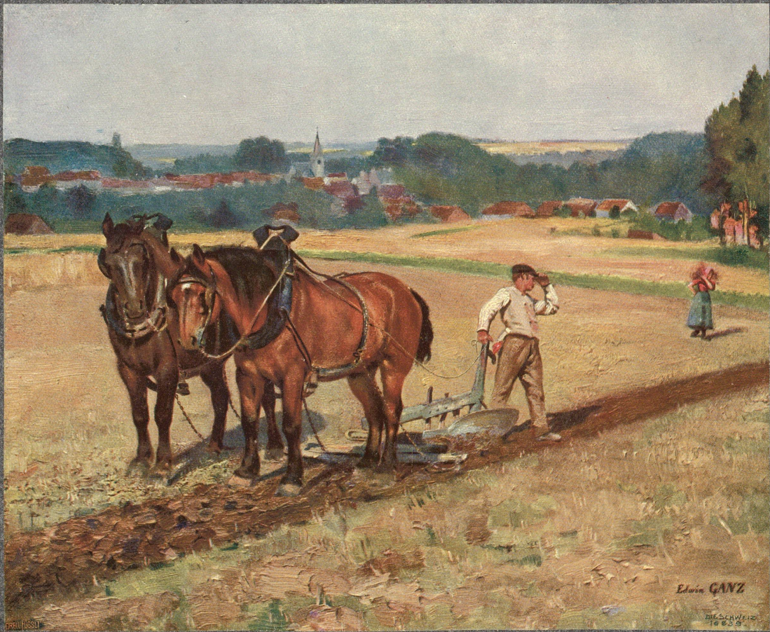
Im August. Nach dem Delgemälde von Edwin Ganz, Zürich-Bühler.