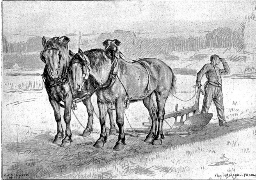
Studie von Edwin Ganz, Zürich-Brüssel, zu nebenstehendem Gemälde „Im August“.

Heimritte aber nichts bemerkt. Da er einen Unglücksfall argwöhnt, geht er über den Grasgarten hinunter und findet da auch tatsächlich den Fazi völlig durchnäßt und in traurigem Zustande. Nun geht er zum Flusse hinab zu der Landzunge, die sich in den Fluß hinein erstreckt, zu dem sogenannten Thúsnavallanes, und hier sieht er die Leiche des Küsters, die an den Rand der Landzunge angetrieben worden war. Sofort macht sich der Bauer nach Myrká auf, um dort das Geschehene zu verkünden. Man bringt den Küster, der am Hinterkopfe durch die Eiszshollen starke Verletzungen erlitten hatte, nun nach Myrká, und eine Woche vor Weihnachten wird er begraben.