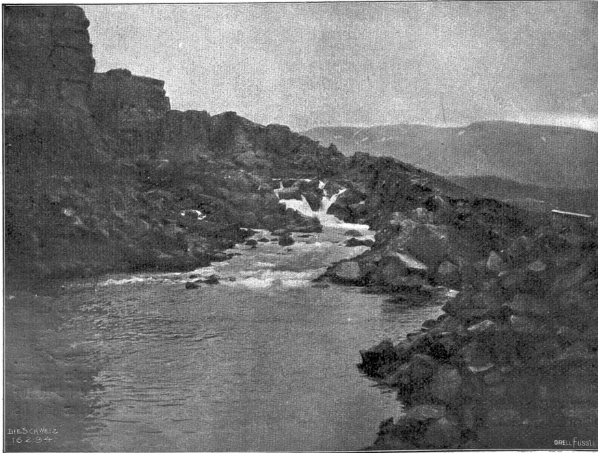
Hus Island. Die Degara und der Verbrechereich in der Almanagjá.

Am andern Morgen sieht der Bauer von Thúsnaballir ein gesattelttes Pferd unterhalb des Grasgartens und glaubt den Fagi des Küsters von Myrká zu erkennen. Er erschrickt; denn er hatte am vorhergehenden Tag den Küster vorbeireiten sehen, von seinem