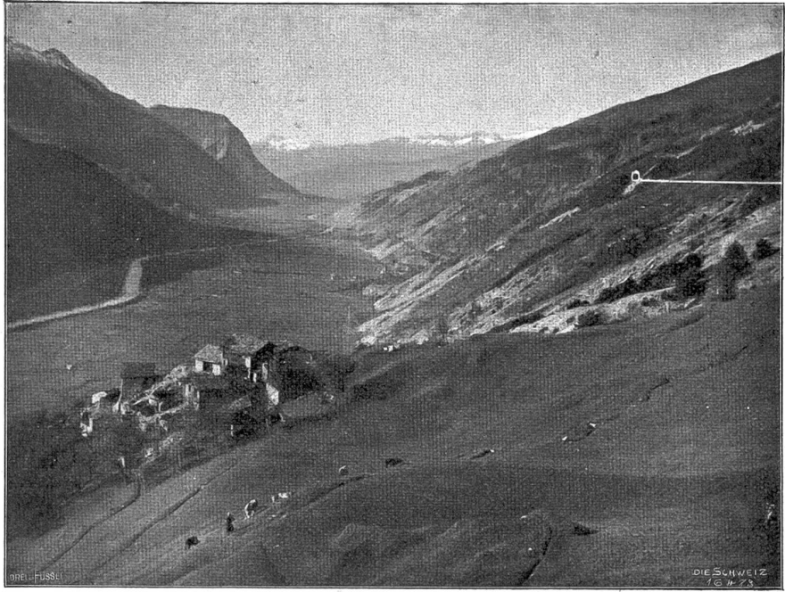
Von der Lötschbergbahn. Blick von der im Bau befindlichen Strecke ob Maron gegen das Unterwallis bis Sitten.

Sie weiß nichts zu sagen, schlägt verwirrt die Augen zu Boden. Wie sie diese wieder aufschlägt, da steht er dicht bei ihr, prächtig anzublicken in seiner hohen Fellmütze, und schaut ihr tief, unwiderstehlich in die Seele hinein, wie damals in der Mitternachtsstunde. Und dann faßt er sie an beiden Händen. Seine Stimme klang anders wie zuvor, als er endlich sagte: „Agafia Semenowna, was geht mit uns vor? Was meint Ihr dazu?“