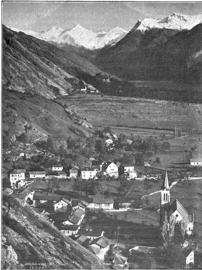
Von der Lötschbergbahn. Gampel am Eingang zum Lötschental, Blick das Rhonetal aufwärts.

es an mir zu seufzen, mit den bösen Schwiegereltern einerseits und dem trunkenen Muschik andererseits!“ Der Kaufleute wegen erklärte sie Tiotja Awdotja, sie möge keine „Swacha“ leiden, sie heirate mal ohne „Swacha“. Awdotja warf aber bei solchem Gerebe die Hände über dem Kopfe zusammen und schlug ein Kreuz nach dem andern: „Gott mit dir, Täubchen, Gott mit dir! Wohin sinnst du, daß du dich so absonderlich gebarest, gegen die Leberlieferung und mädchenhafte Sitte! Woher fliegen dir solche Gedanken zu? Gehst zu oft allein in den Wald, raunt dir da der ‚Djeschi‘ 1) Ungebührliches zu! Sieh zu, daß deiner christlichen Seele kein Leid geschehe, und denke sittsam an den künftigen Eheherrn!“