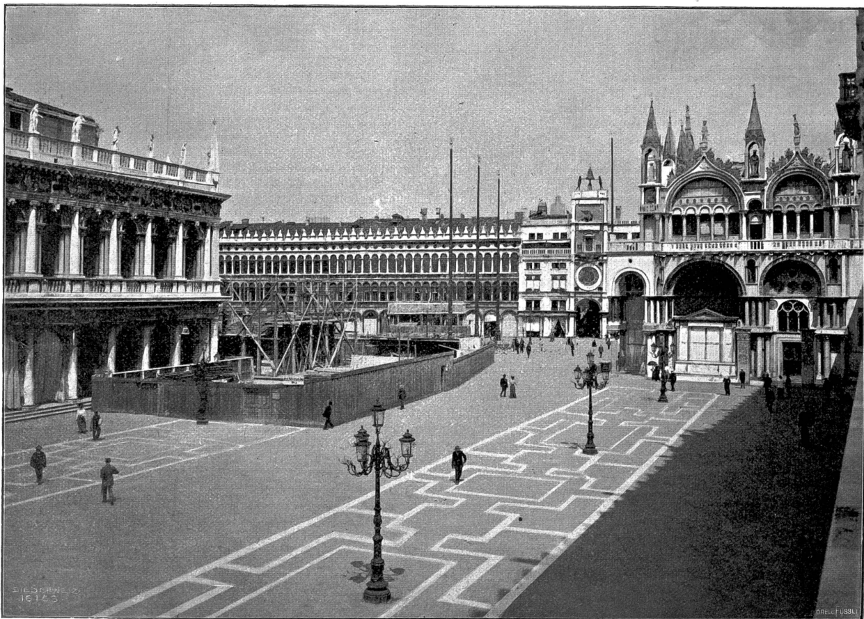
Vom Schicksal des Campanile von Venedig. Der Markusplatz mit dem Baugerüst.

So wurde von der Sache an dem Tage auch nicht mehr gesprochen. Aber am nächsten kam Holm wieder zu Anna, um sie zu überreden, ihm die Schale zu überlassen. Das half aber nichts, und zuletzt sah er das Hoffnungslose seines Unternehmens ein und gab seinen Plan auf — wohlgerne nur anscheinend; denn in Wirklichkeit dachte er beständig an die Möglichkeit, in Besitz des Schatzes zu gelangen; er wußte nur selber nicht, auf welche Weise und mit welchen Mitteln. Er kam schon seit Jahren zu Besuch bei Emma Severinsens Schwester, die zu besuchen er stets einen Vorwand hatte, da Anna, die sich mit seiner Herrenwäsche beschäftigte, von ihm haufenweise Bestellungen in aller möglichen Leinwand erhielt — oder er ließ ihr auch Bücher, die er regelmäßig umtauschte. Aber wenn er bei ihr war, setzte er sich stets an ihren Nähtisch, auf dem die Schale jetzt als Nähkorb stand, und Anna, die seine heimlichen Gedanken leicht erriet, gestattete ihm gern, die Schale auszulernen und still und bewundernd das schöne Kunstwerk zu betrachten, das die Jagdgöttin Diana und ihre mit Pfeil und Bogen bewaffneten Nymphen darstellte, die drei gefangene junge