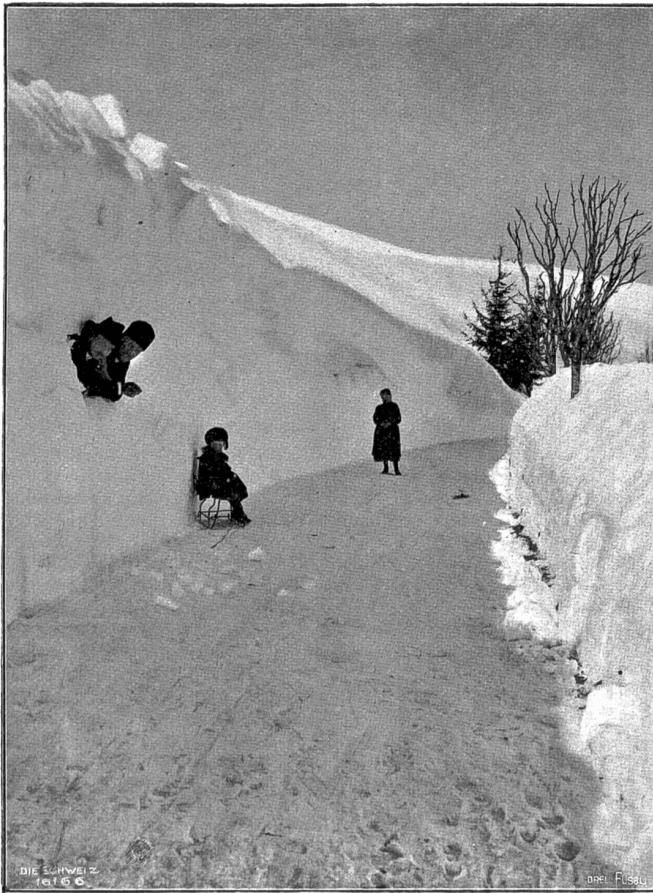
Vom langen Winter 1906/07. An der Poststraße von Trogen nach Appenzell.

Tiger an Ketten hielten. Und ebenso schön wie diese figurenreiche Szene, war auch der Mand der Schale, der mit den verschiedenen Himmelszeichen Zunafrun, Wage, Stier u. s. w. geschmückt war. Karsten Holm konnte sich nie an der kleinen Schale satt sehen, und jedesmal ging er, in tiefe Gedanken versunken, mit der traurigen Gewißheit nach Hause, daß er sie wohl nie besitzen werde.