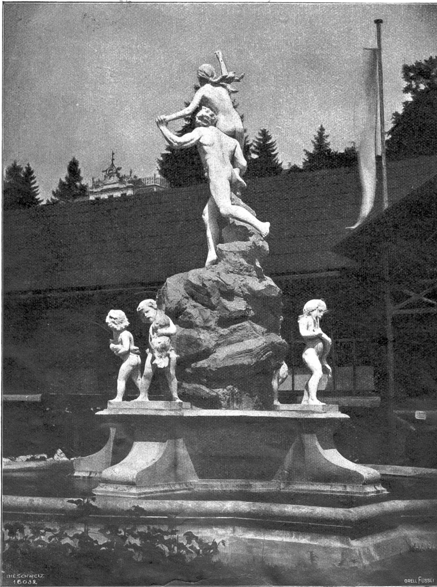
Rhein und Aare mit Nebenflüssen. Entwurf von Hugo Siegwart, Luzern-München, für einen Monumentalbrunnen mit Allegorie nach J. B. Sebels Gedicht „Die Aare“, ausgestellt an der Kant. Gewerbeausstellung zu Luzern 1893.

Das hatte Peter Lang die letzten Jahre her erlebt. Es kam aber wieder ein Frühling, der fand den Knaben nicht mehr den Stimmungen preisgegeben, die der wech-