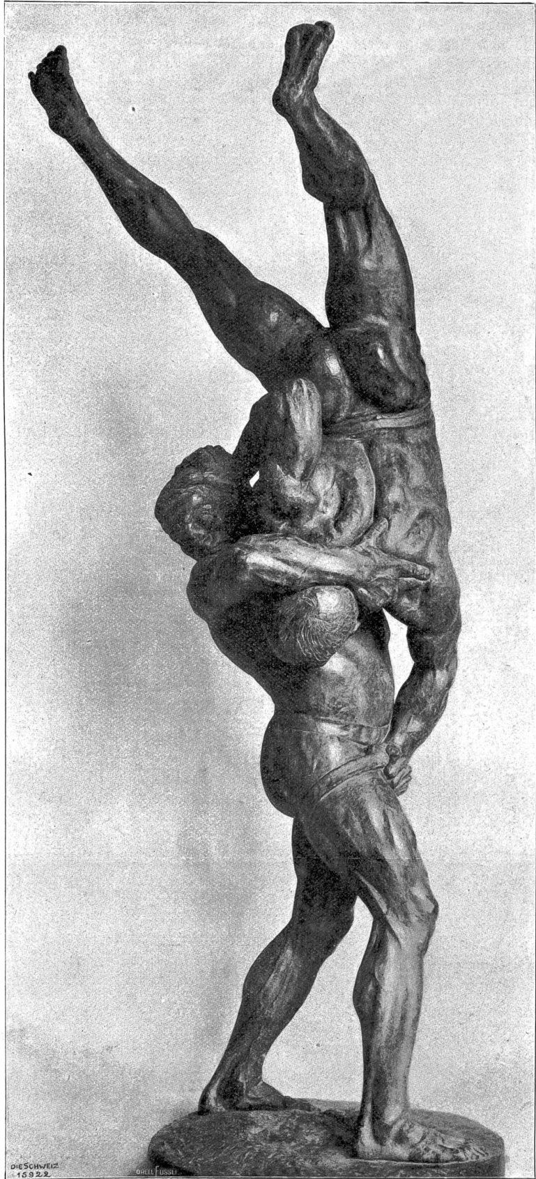
Schwingergruppe. Plastik (1905) von Hugo Siegwart, Luzern-München, an der IX. Internationalen Kunstausstellung zu München (1905) mit der kleinen Goldenen Medaille ausgezeichnet.

Die ernstesten Leute von Linda wurden lustig; sie sangen wilde alte Soldaten- und Minnelieder und hängten an jedes einen meckernden Jodel. Aber von den Plätzen der lustigen Rheinbader klangen traurige Weisen vom Scheiden und Meiden, vom Grab und vom Tod.