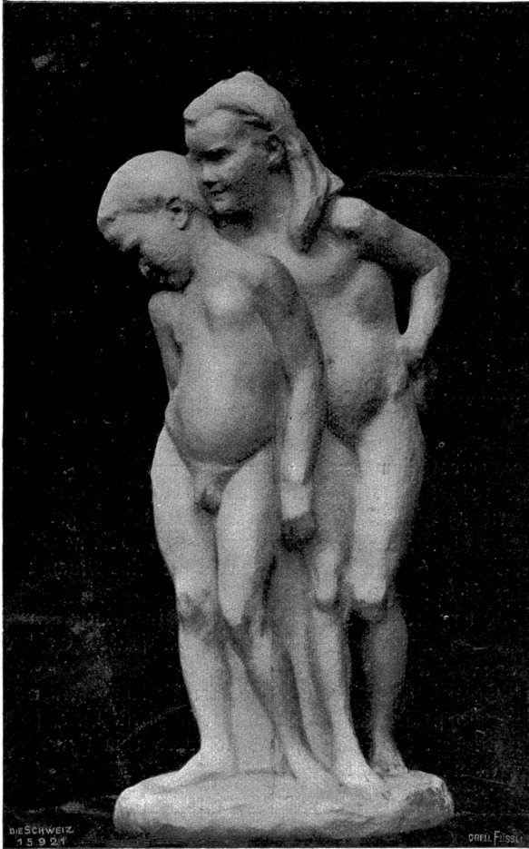
Kindergruppe (1905) von Hugo Siegwart, Luzern-München.

Es war für Peter eine Wollust dies zu schauen. Wenns einen Gott gab, er hatte ihn nun gestraft, daß er ihm ein so einsam trauriges Leben beschieden, keine Freude und kein Glück. Mit dem Stolz des Rheinbaders, der in seinem Gefühl Großes vollbracht, zog er heimwärts.