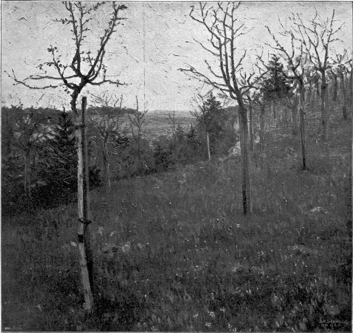
Aprilabend. Nach dem Gemälde von Fritz Schwalb, Zürich-München.

Mir gefiel der Singjang gar nicht, die Sängerin wurde jedoch lebhaft beglückwünscht. Zwei Stunden übt sie jeden Tag! Mir tun die Hände leid, die so lange Dual erdulden müssen. Die Klaviermolly übt täglich vier Stunden, ihre Nachbarin nur drei, da sie nebenbei noch Malstunden nimmt. Von Arbeit sprachen die Fräulein keinen Ton.