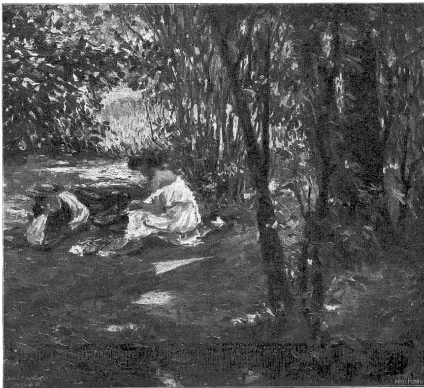
Sommertag. Nach dem Gemälde von Fritz Oswald, Zürich-München.

Die Mütter sind bereits aufgestanden, da es schon elf Uhr