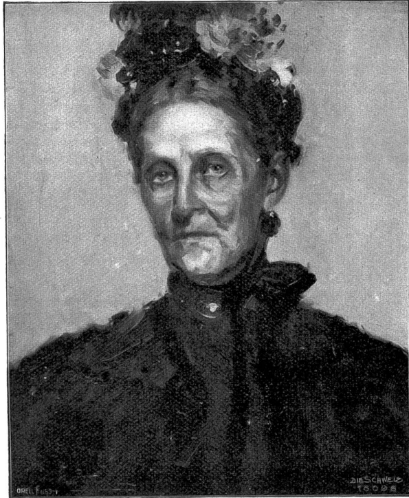
Studienkopf. Nach dem Gemälde von Fritz Schwalb, Zürich-München.

„Kinder, Kinder! Den verdrehten Geiger schaut an! Er hat sich verliebt in mich, toll hab' ich ihn gemacht . . . Immer