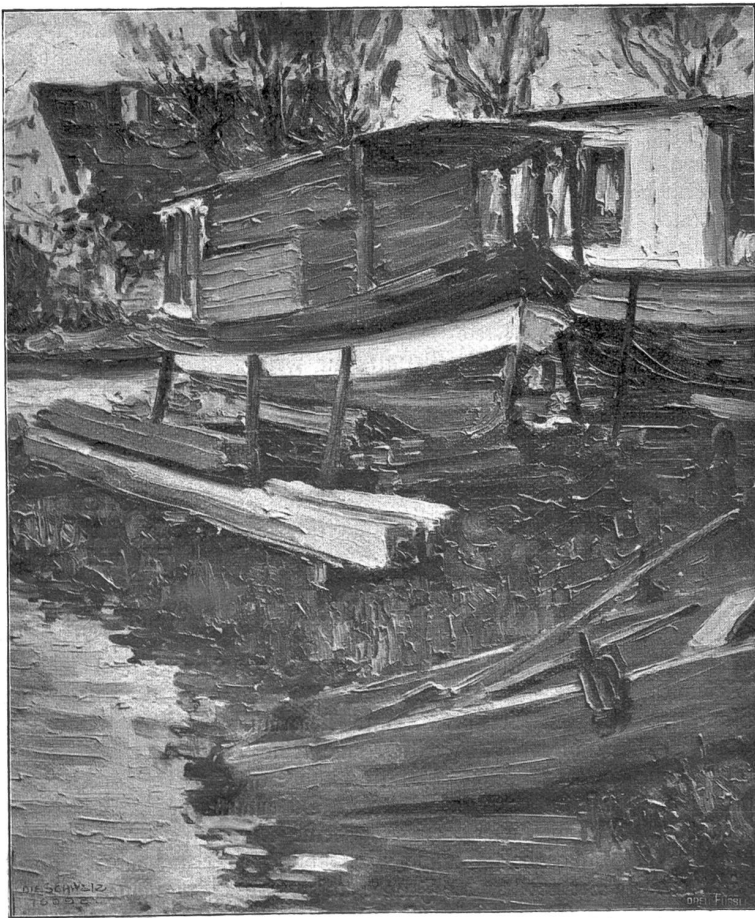
Schiffe. Nach dem Gemälde von Fritz Schwald, Zürich-München.

Der zweite Geiger erhebt sich, um die Führung zu übernehmen. Ein schlankes Bürschchen, sehr, sehr jung noch, wohl kaum seine siebzehn Jahre alt. Blaue Jacke, goldene Schnüre — beschmückt und angelauten wie alle hier . . . Ein schmales blaßes Gesicht, tiefliegende melancholische Augen, tiefschwarzes Haar! Das