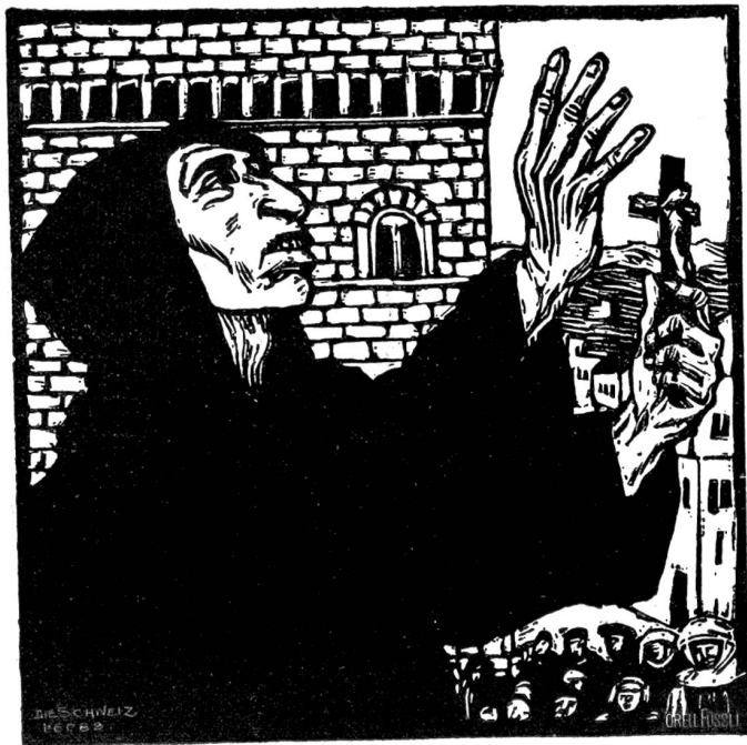
Savonarola.

wieder ein anderes unter Tosen und Gebrüll in einen gähnenden Fajßchlund hinuntersauste als in eine Höhle. So waren jene Bergfahrten im Lande Juda so voll Mücken und Tücken, wie ich seither keine mehr gemacht. Und wenn's dann schließlich nur noch Löcher und Höhlen und gähnende Klüfte gab und keinen gangbaren Weg mehr dazwischen, dann holten wir die Stelzen und hatten damit nach den Fahrändern und den Stuhlbeinen, bis alles, Fajßreisen und -dauben und Wellen und Risten und Tische, kurz das ganze Gebirge, in einer Lawine zu Tal fuhr, worauf wir mit mörderlichem Siegesgeschrei Reißaus nahmen.