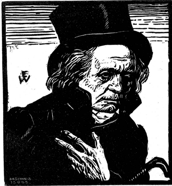
Beethoven. Nach Originalholzschnitt von Ernst Birtenberger, Zürich.