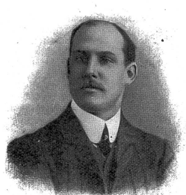
Rodolphe de Haller, Vizepräsident des Direktoriums der schweiz. Nationalbank.