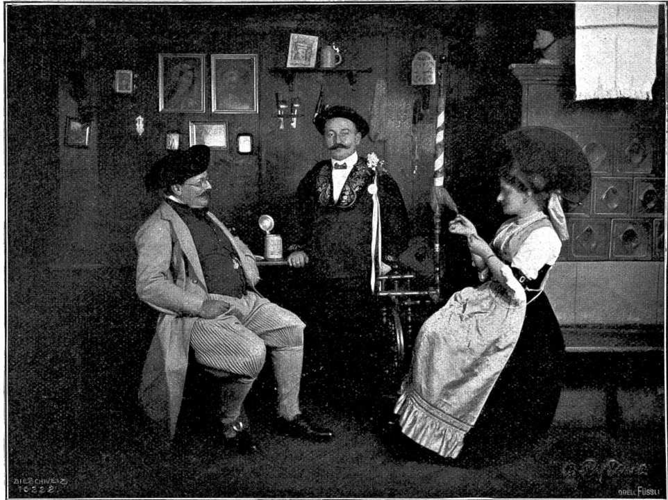
Von der Bauernkirchweib des Lesekirkels Hottingen. Behntaler, Unterwaldner und Appenzellerin.

Wie wir aus den Ferien heimgereist sind und das Dampfschiff am Tannengut vorüberfuhr, da ist das Bali mit dem Gärtner auf dem See gewesen. Ganz nahe sind sie herangerudert, daß das Bali uns noch einmal zurufen konnte, ganz langgedehnt: „Abjöö!“ Hinten am Schiff hab' ich gewinkt und zugehört, wie das kleine Nuderschiff in die Höhe gehoben ward von den Wellen