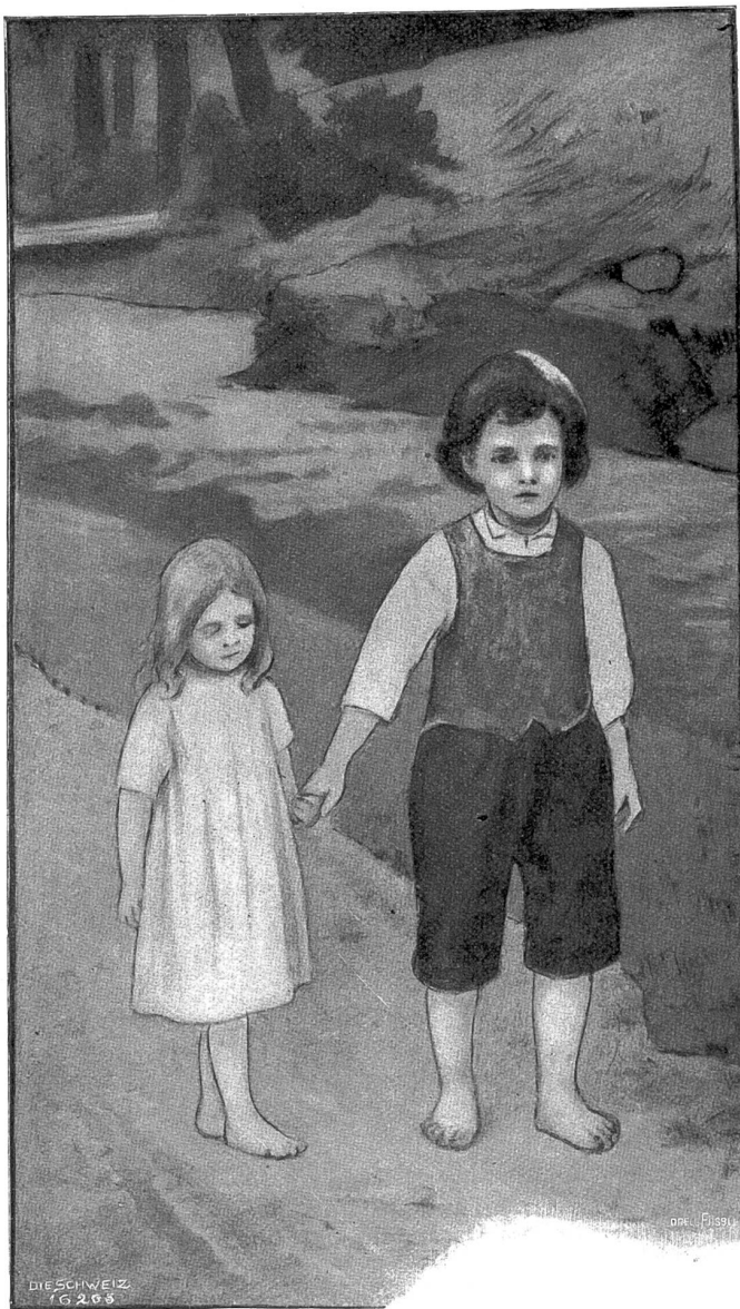
Aus einem unveröffentlichten Illustrationszyklus zu Johanna Spyris Jugendchriften: Bafli und Fränzeli. Nach Farbstiftzeichnung von Meta Löwe, Zürich. 32

im Walde, schöner als alles, was das arme Kind bisher gesehen, sodaß es wie geblendet schaute. Der Prinz verneigte sich in tiefer Ehrerbietung vor Sonnenscheinchen, als wäre es nicht ein schlichtes Häuslerkind, sondern eine vornehme Prinzessin von königlichem Geblüte. Alsdann berührte er mit einer lächelnden Zuversicht die lichte Blume in Sonnenscheinchens Hand, die vor Erwartung immer erregter hin- und herschwante, und wunderbar, kaum hatte die Hand des Prinzen ihr Leuchten gestreift, als dem sanften Scheine ihrer Krone ein Mägdlein entstieg, dem Prinzen ebenbürtig an Schönheit! Dieser faßte das wunderholde Menschenbild zierlich bei den zarten Fingerspitzen und ließ sich vereint mit ihm ins Knie nieder vor dem armen Kinde: „Du hast uns erlöst!“ sagte er, und ein heimliches Frohlocken läutete in seiner Stimme. „Wohl an die hundert Jahre warteten wir. Ach, wie sehr warteten, das glaubst du kaum! Wir liebten uns, Prinzessin Wunderhold und ich Prinz