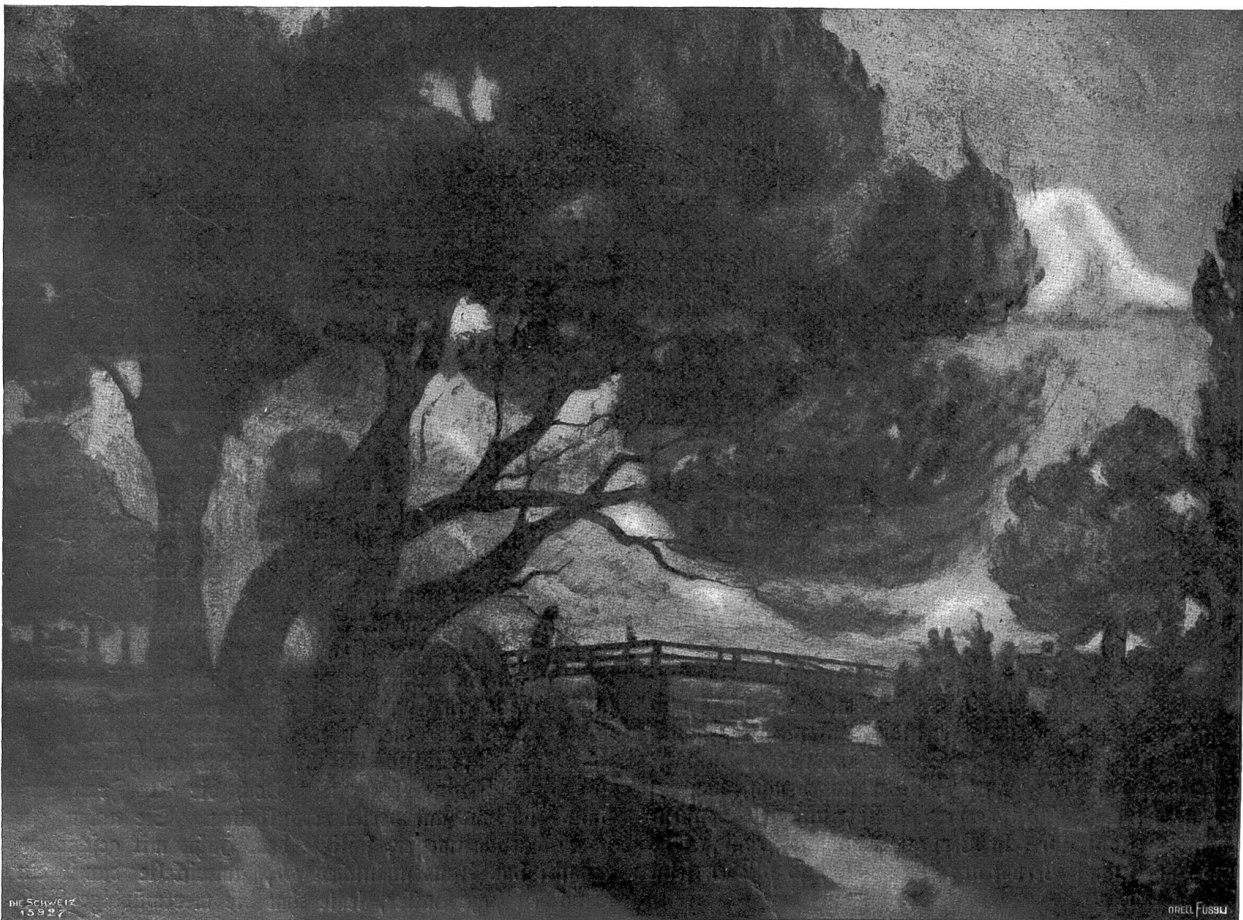
Abend an der Mitterndorfer Brücke. Nach der Malerung von Charles Felber, Wädenswil-Dachau.

„Meine Mutter hat auch oft traurige Augen,“ nickt das kleine Mädchen verstehend. „Erzähle mir ein paar von deinen Märchen; dann sage ich sie meiner Mutter,