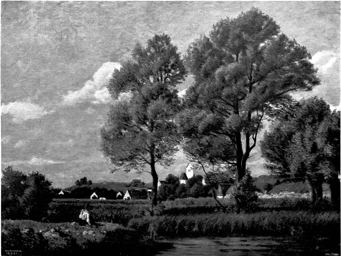
Sonnerstag (Motiv bei Mitterndorf). Nach dem Delgemälde von Charles Felber, Wädenswil-Dachau.