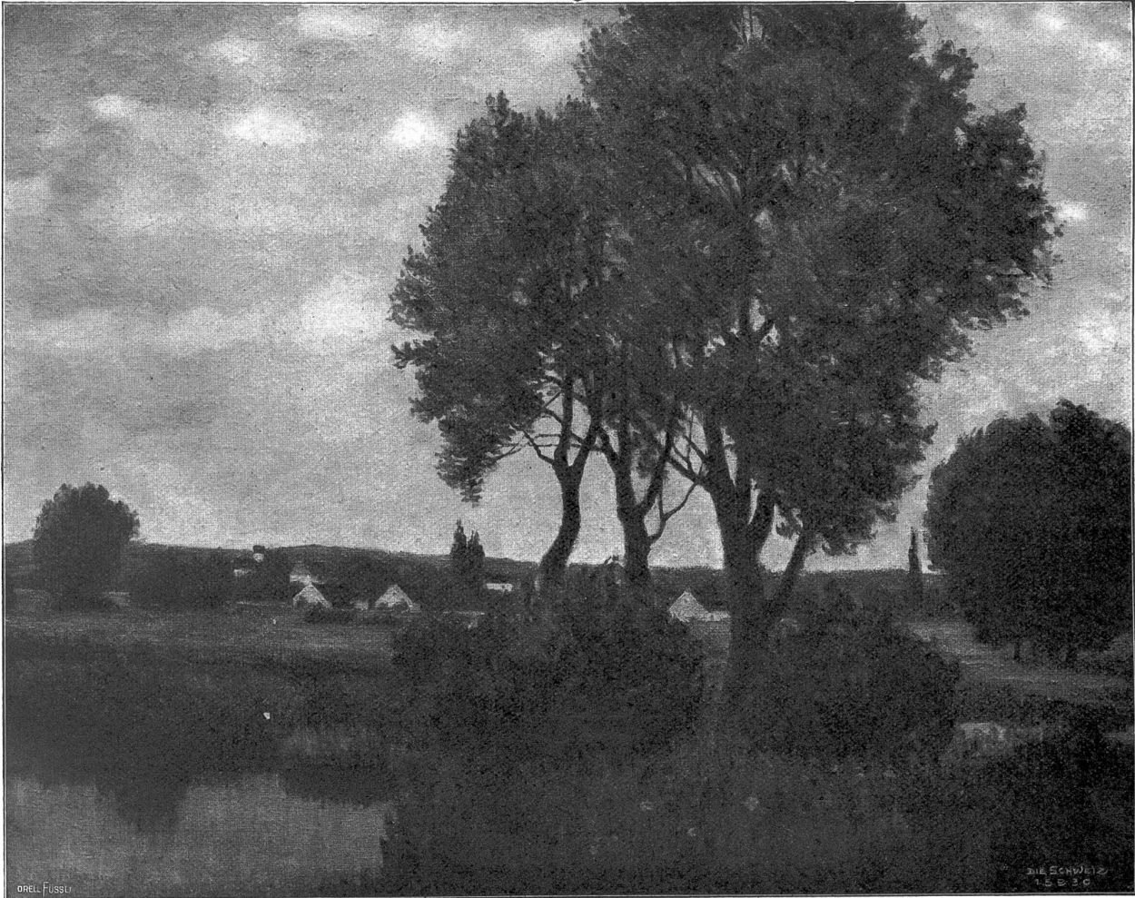
Trüber Tag (Motiv bei Ehenhausen). Nach dem Delgemälde von Charles Felber, Wädenswil-Dachau.

in den Schnabel und sagte mit einer uralten Stimme, die wie eine beschädigte Flöte tönte: ‚Nun schluck!‘