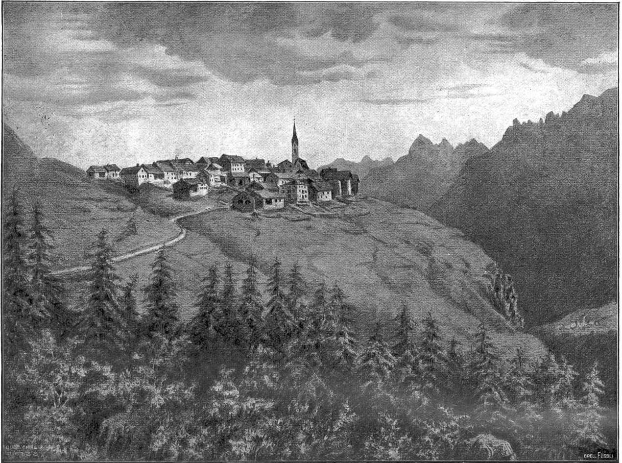
Unterengadin Abb. 2. Guarda aus der Ferne. Nach Zeichnung von Ernst Buß, Clarus.

darüber auf ausichtsreicher Bergterrasse malerisch gelegen Guarda (1650 m, s. Abb. 2), nach der Volksüberlieferung wie Lavin und Ardez ein altes Etruskerstädtchen, nun reizende Sommerfrische, und tiefer unten, interessant durch schöne alte, mit Erfern, Wappen und Schildereien geschmückte Herrenhäuser, das ansehnliche Ardez (s. Abb. 3). Unser Bild zeigt in der Mitte das Dorf mit der Kirche, deren Inneres durch seine stimmungsvolle Architektur bemerkenswert ist, links auf steilem Felsen die Burg Steinsberg und die Ruine der einstigen St. Johannskapelle, im Hintergrund unmittelbar über dem Burgturm den Sarfuragletscher, rechts daneben den Piz del Nös, in der Mitte die schöne dominierende Spitze des vergletscherten Flüela-Schwarzhorns (3151 m) und rechts den Piz Chapuffin, im Vordergrund endlich die durch Felsen sich emporarbeitende Straße nach Fetan. Der Inn, nicht sichtbar, zwingt sich hinter dem Schloßberg weit unten in der Tiefe durch. — Eine Stunde oberhalb Ardez liegt auf freiem Hochplateau der stille, idyllische Luftkurort Fetan (1650 m), dessen entzückender Rundblick auf das oben geschilderte Panorama der südlichen Unterengadiner Alpen, verbunden zugleich mit dem Blick auf das ganze unten liegende Tal mit seinen Ortschaften und Schlössern, sich jedem Beschauer unvergeßlich einprägt (s. Abb. 4).