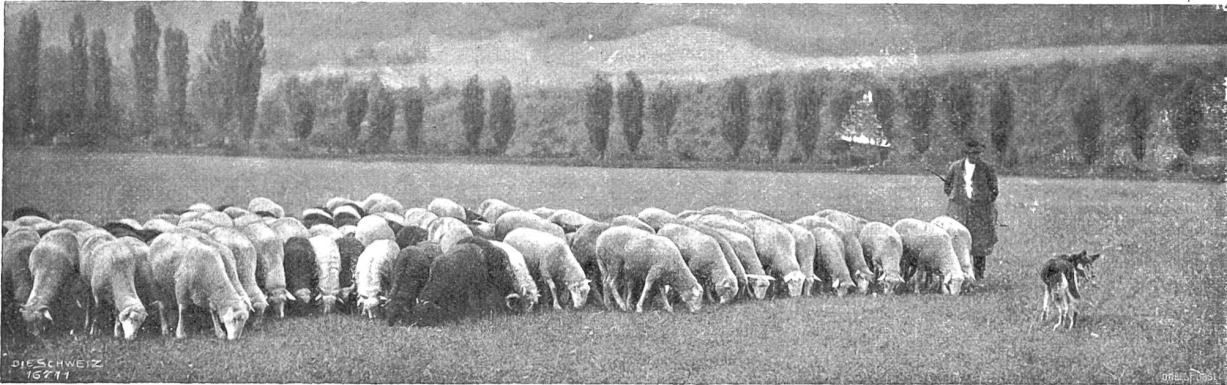
Herbststimmung (Phot. Anton Krenn, Zürich).