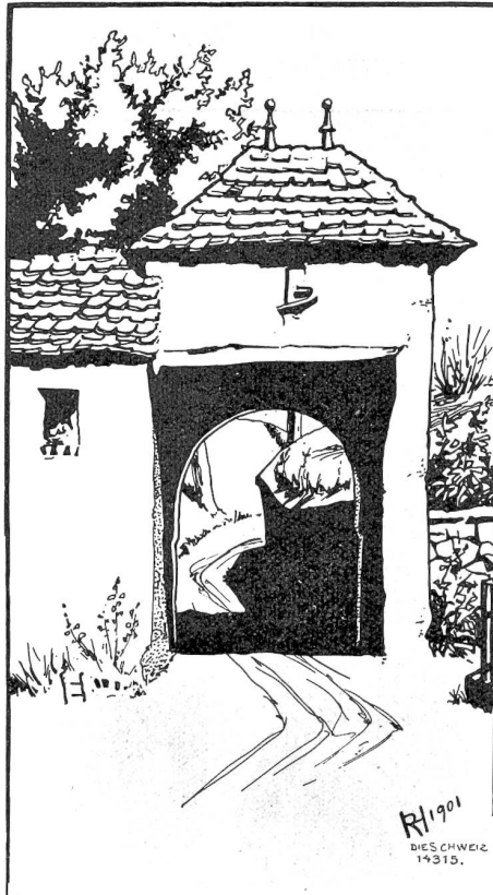
Pförtchen im Katharinenkloster bei Diebenhofen. Nach Federzeichnung von Robert Garbmeyer, Küsnacht bei Zürich.

Aber jetzt erst recht! Ganz allein will ich die Felsen stürmen, die den Olymp verrammeln. Ich muß und will! Mit einer neuen Seele und einem neuen Namen will ich vor die Menschheit treten und mein Urteil noch einmal von ihr empfangen. Weg mit all dem Kleinen, das mir nur kleinen Erfolg bringen kann, weg mit Gedichten, Feuilletons, Plaudereien, Skizzen! Ein großer Wurf gleicht alles aus. Ein Roman! Unter einem Pseudonym soll er in die Welt fliegen und mir Liebe werben. Liebe! Vielleicht, daß das Schicksal sich des