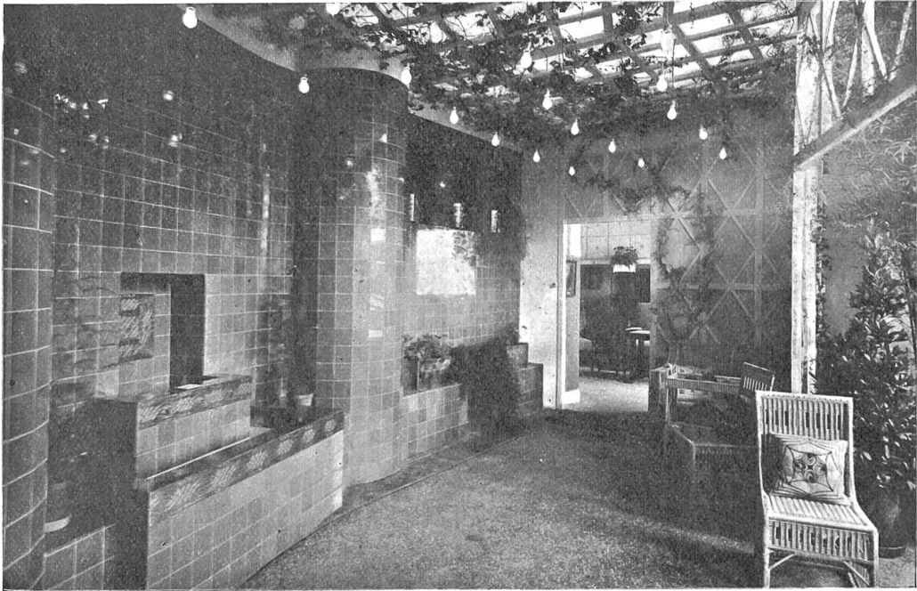
Pergola, entworfen und ausgeführt von Gebr. Lindt, Zürich.

Als sie seinen Schritt im Flur hörte, erwachte sie aus der Lethargie und lauschte ganz verzückt. Als er eintrat, schaute