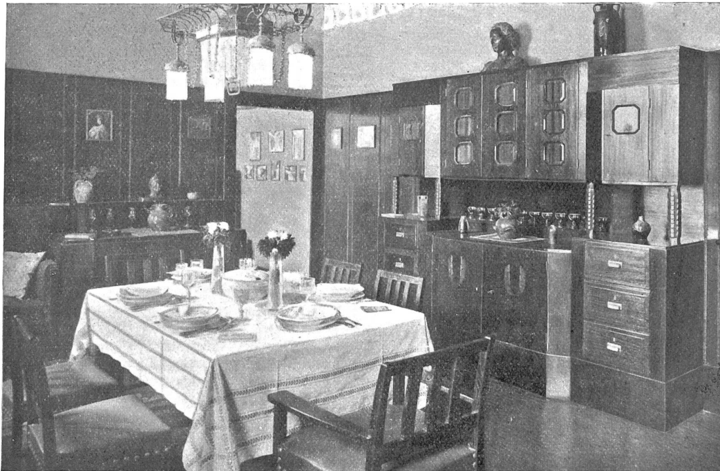
Esszimmer, nach Entwurf von Bischoff & Weidell, Zürich, ausgeführt von S. Ufshacher, Zürich.

Wir andern drei verhielten uns schweigend. Mich stieß das