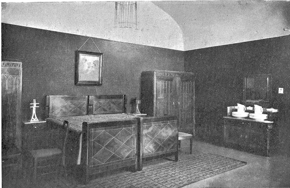
Schlafzimmer, nach Entwurf von Mittmeier & Furrer, Winterthur, ausgeführt von C. Gilg-Steiner & Co., Winterthur.

Diese Käthi, die damals schon das Entsetzen der korrekten, schlanken Claire gewesen,