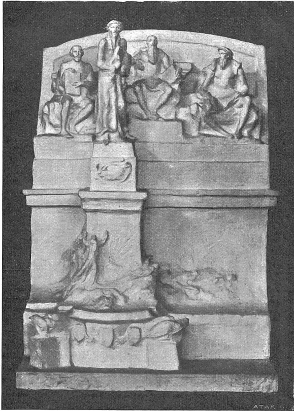
Vom Wettbewerb für das Genfer Reformationsdenkmal. Der mit einem dritten Preis ausgezeichnete Entwurf von Architekt Ch. Blumet, Gené (Frankreich), und Bildhauer Aug. de Niederhäusern-Rodo, Bern.

(1812). „Die alte Mythe von der Delila und Simson ist eine der ungeheuersten. Eine ganz bestialische Leidenschaft eines überkräftigen gottbegabten Helden zu dem verfluchtesten Luder, das die Erde trägt.“